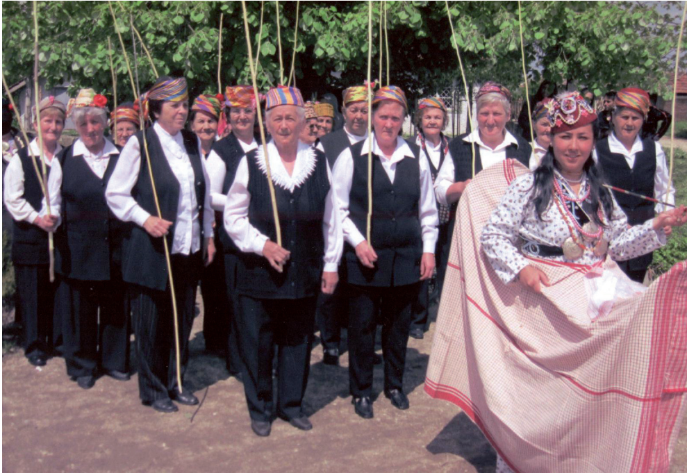
Илюстрация 3. Хъдрелез, НЧ „Стефан Караджа – 1928“, с. Бисерци, Разградско; фотограф Милена Любенова Illustration 3. Hadrelez, Chitalishte „Stefan Karadzha – 1928“, Biserici, Razgradsko; Photographer Milena Lyubenova

вързките на съвременния човек с културното наследство. Образователните практики, които читалищата предлагат, са в областта на неформалното обучение, извънучилищните занимания, свободното време, привличат не само деца и ученици, но и хора от всички възрасти, обхващат не само представители на местната общност, но и хора, идващи отвън, с отношение и проявен интерес към местната традиционна култура.