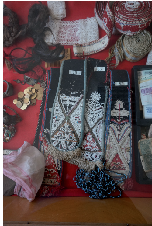
Илюстрация 4. Етнографска сбирка, НЧ „Мургаш – 1929“, Желява, София-град

Всичко това създава реална опасност за физическото съхраняване на движимото културно наследство. Към произтичащите от набеязаните проблеми ефекти трябва да се добави липсата на системни инициативи за неговото популяризиране и социализиране (сред местната общност и външни публики). Те са добре застъпени в някои читалища, но в други с не по-малко богати фондове са напълно непозната проява на читалищната работа. За тази цел е необходима системна експертна помощ не само от музейни специалисти, архивисти, фолклористи и етнографи, но също и от компютърни специалисти, които да подпомогнат процесите по дигитализация на натрупаните в читалищата фондове. За това са нужни също институционални и финансови инструменти. Повишаването видимостта на културните ценности, съхранявани в читалищата, би могло да се случи чрез най-разнообразни форми, но също и чрез сравнително иновативните и добиващи популярност през последните години образователни инициативи в интернет среда.