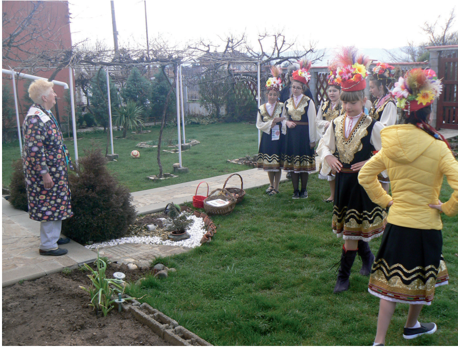
Илюстрация 1. Лазаруване, НЧ „Мироско Райчев – 1927“, Горни Богров, София-град