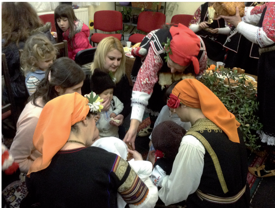
Илюстрация 2. Бабинден, НЧ „Св. Цар Борис III – 1901“, Бистрица, София-град Illustration 2. Babinden, Chitalishte „St. Tzar Boris III – 1901“, Sofia-city

Те участват в изработването на Националния регистър на НКН на България, като подават актуални данни за съществуващите в съответните селища елементи. Включват се активно в практическото изграждане на Националната система „Живи човешки съкровища – България“, като имат право (както и музеите, а през последните години и други НПО) да подготвят предложения/кандидатури за системното ѝ попълване 7 . Международно признание за работата им е вписването на самата институция в Регистъра на добрите практики в опазването на НКН на ЮНЕСКО през декември 2017 г. 8 Как е разположена една от най-значимите функции на читалищата в нормативната им уредба обаче?