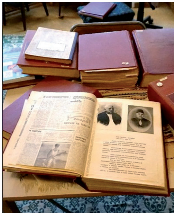
Илюстрация 6. Архивна сбирка, НЧ „Мургаш – 1929“, Желява, София-град; фотограф Даниел Фокас Illustration 6. Archival collection, Chitalishte „Murgash – 1929“, Zheljawa, Sofia-city; Photographer Daniel Fokas

В настоящия текст бяха набелязани една малка част от проблемите, пред които са изправени читалищата при реализиране на образователни практики за опазване и социализиране на културното наследство и които имат връзка с действащата за тях нормативна уредба. Възможните перспективи за тяхното разрешаване предполагат прецизиране на предписанията в законодателните документи, синхронна работа на всички равнища (национално, регионално, местно) и подобряване на диалога и координацията между читалищата и всички институции и лица, ангажирани с опазването на културното наследство (експерти от Министерство на културата, местни власти, РЕКИЦ, научноизследователски и образователни институции, музеи, НПО и др.).