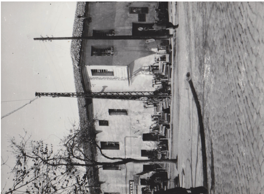
Обр. 2. Панаир хан, Пловдив