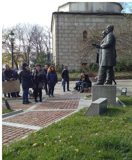
Пред паметника на радетелите Евлоги и Христо Георгиеви