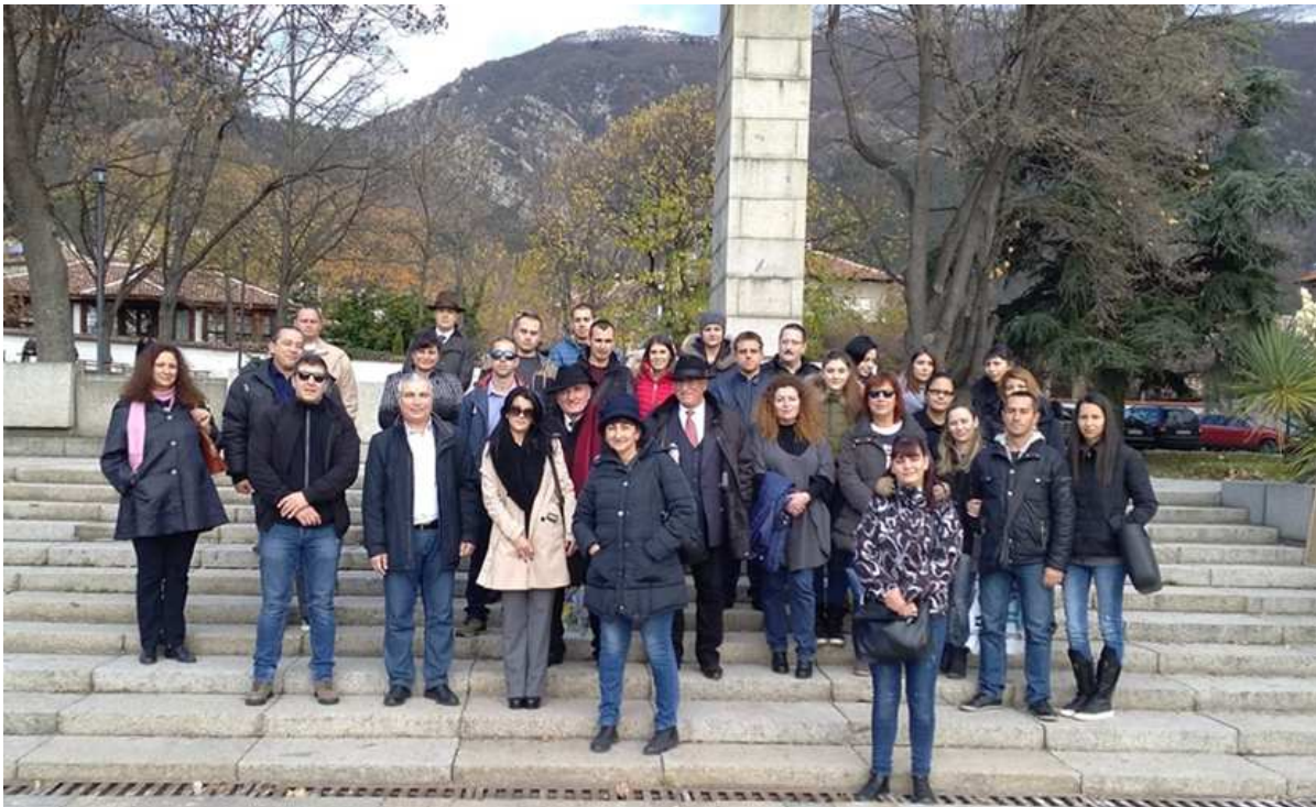
Част от екипа на теренно проучване в гр. Карлово