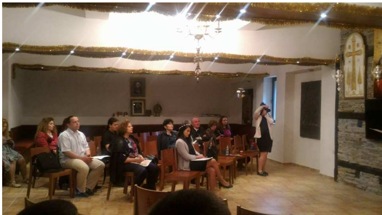
Моменти от конференцията