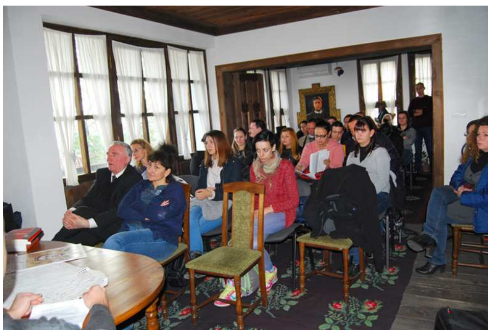
По време на научения семинар, проведен в Националния музей „Васил Левски“ посветен на живота и делото на Апостола.