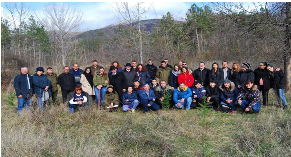
Преподаватели, студенти и докторанти засадиха дървета в Гората на Апостола