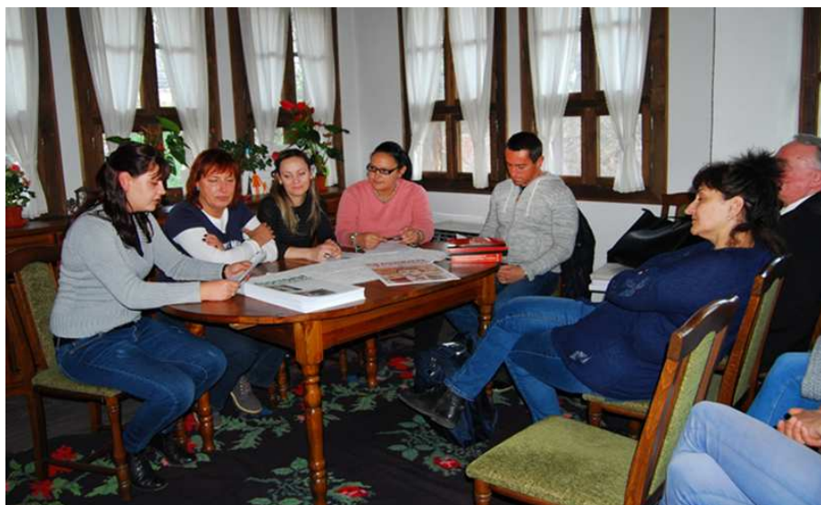
По време на научения семинар, проведен в Националния музей „Васил Левски“ посветен на живота и делото на Апостола.