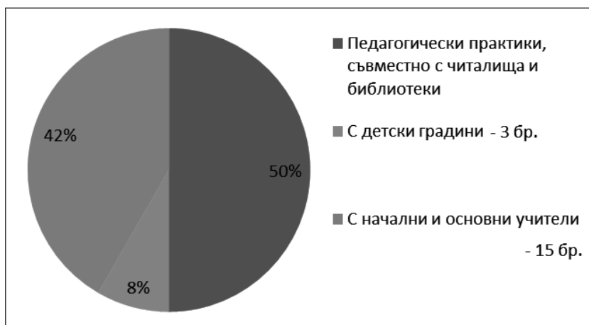
Диаграма 2. Реализирани педагогически практики от детски градини и начални и основни училища от общия брой съвместни педагогически практики с библиотеки, представени на Националната научно-практическа конференция „Добри педагогически практики в областта на образователната интеграция на деца и ученици от етническите малцинства”, Велинград, 2017 г.

Обобщените резултати от споделените добри педагогически практики на Националната конференция във Велинград показват, че присъствието на институцията библиотека в извънкласното време на учениците не е достатъчно застъпено. Взаимодействието между двете институции: училища и библиотеки, все още е слабо развито. Множеството проекти са насочени към извънкласни дейности, провеждани в самото училище. Така например изграждането на филиал на смолянската РБ „Николай Вранчев” в ОУ „Юрий Гагарин” с цел компенсиране на далечните разстояния и финансовите разходи, е добра идея. Но по този начин се получава вторична сегрегация на учениците от ромския етнос. Те остават капсулирани в района квартал–училище–квартал.