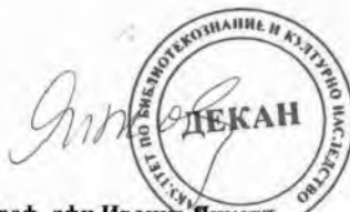
Проф. д-р Иванка Янчева Декан на ФБКН при УниБИТ