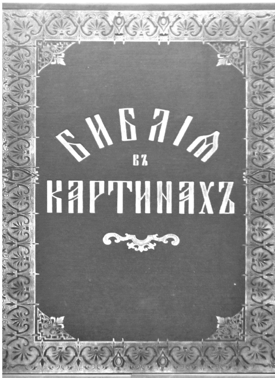
Библия в картинах, 1901