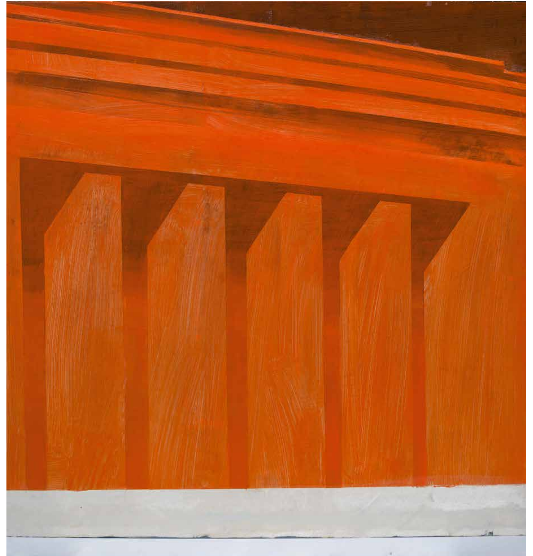
Монумент, 2020-21, акрил, платно, 140x150x3 см Monument, 2020-21, acrylic, canvas, 140x150x3 cm