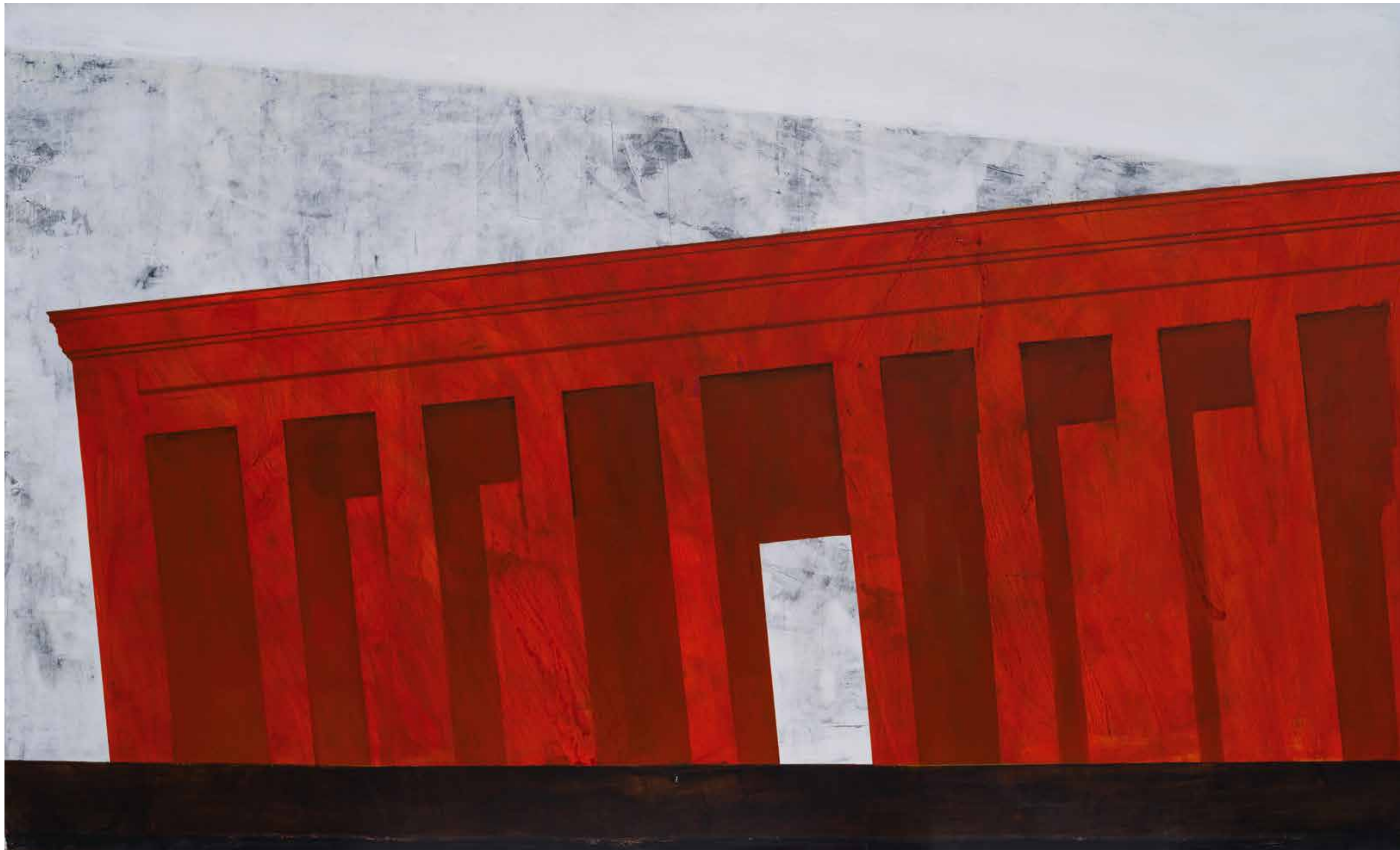
Монумент, 2021, акрил, платно, 180x300x3 см Monument, 2021, acrylic, canvas, 180x300x3 cm