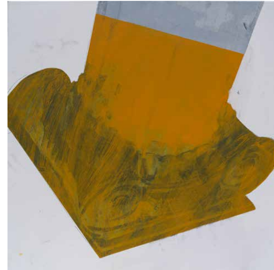
База, 2021, акрил, платно, 70x70x2 см Base, 2021, acrylic, canvas, 70x70x2 cm