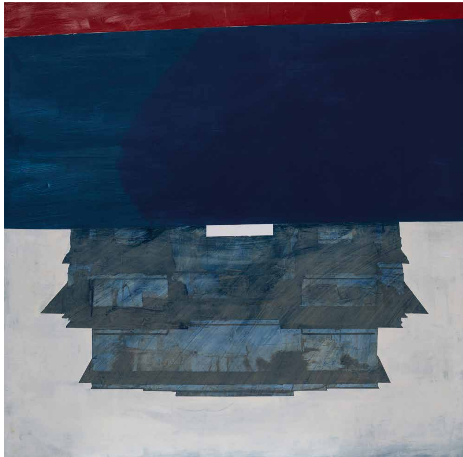
Китай, 2020-21, акрил, платно, 180x180x3 см China, 2020-21, acrylic, canvas, 180x180x3 cm