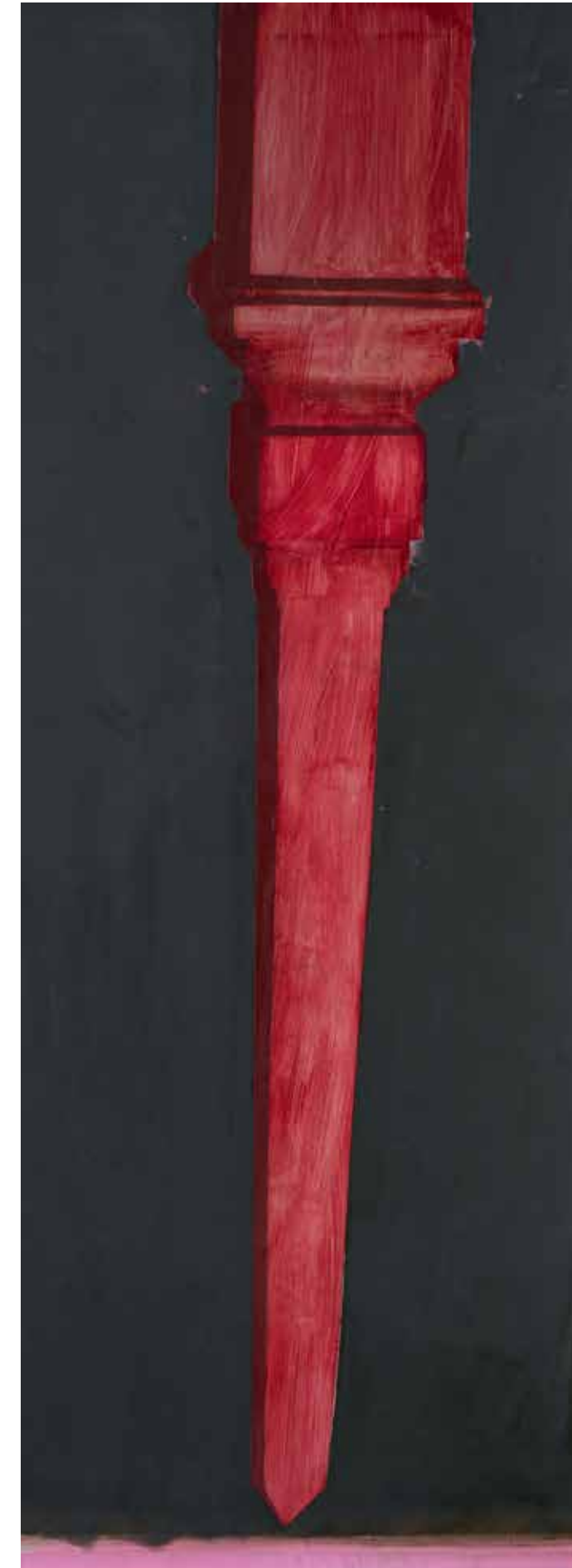
Обелиск, 2021, акрил, платно, 200x72x3 см Obelisk, 2021, acrylic, canvas, 200x72x3 cm