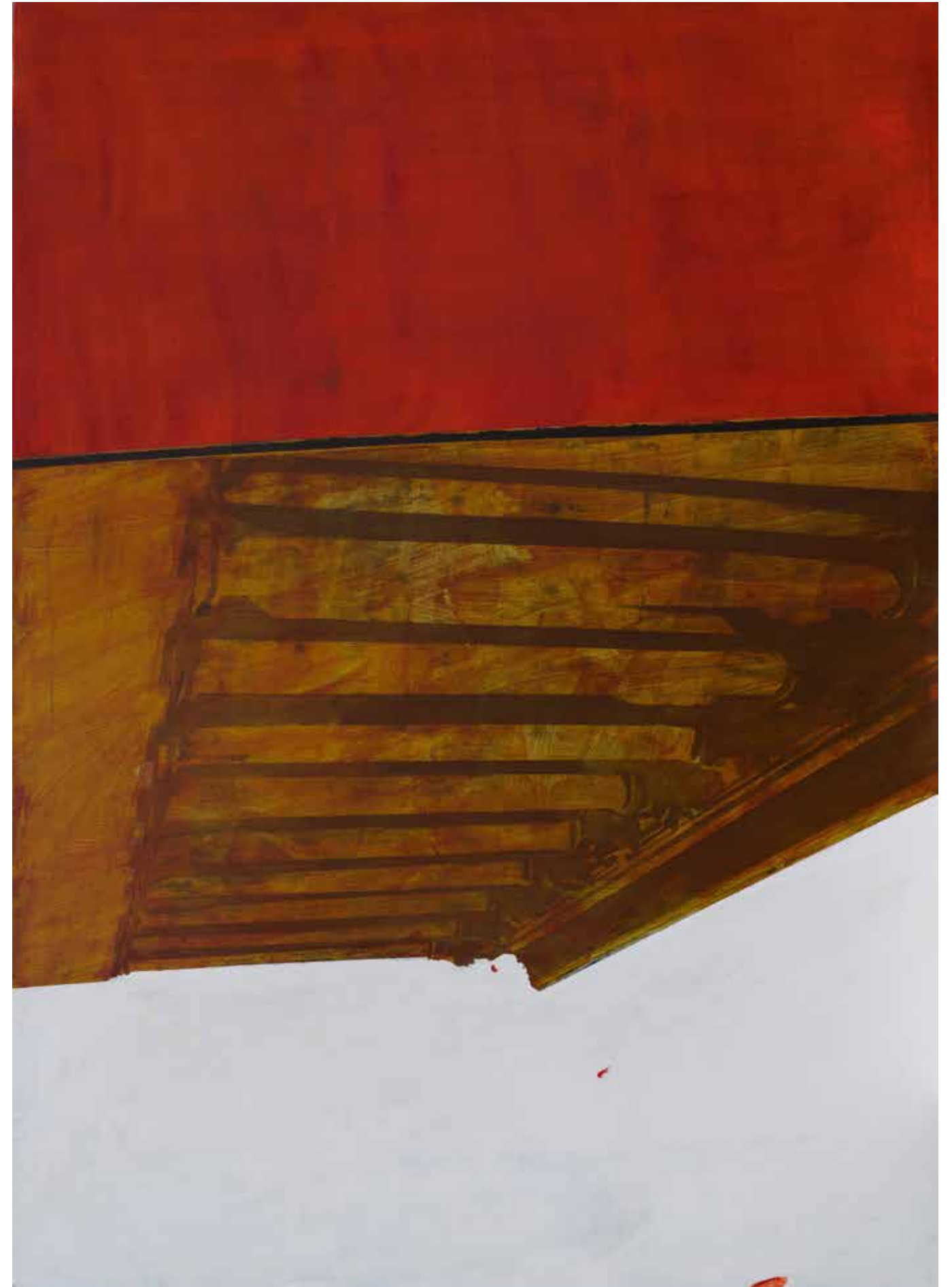
Колнада, 2021, акрил, платно, 250x180x3 см Colonnade, 2021, acrylic, canvas, 250x180x3 cm