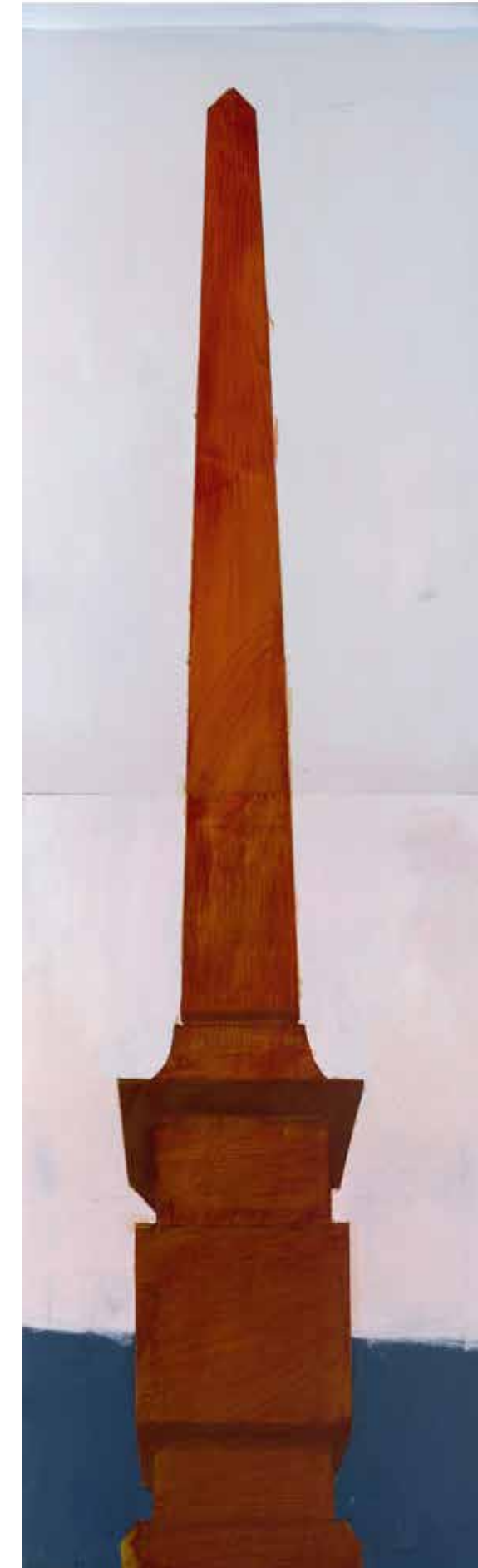
Обелиск, 2020-21, акрил, платно, 240x72x3 см Obelisk, 2020-21, acrylic, canvas, 240x72x3 cm