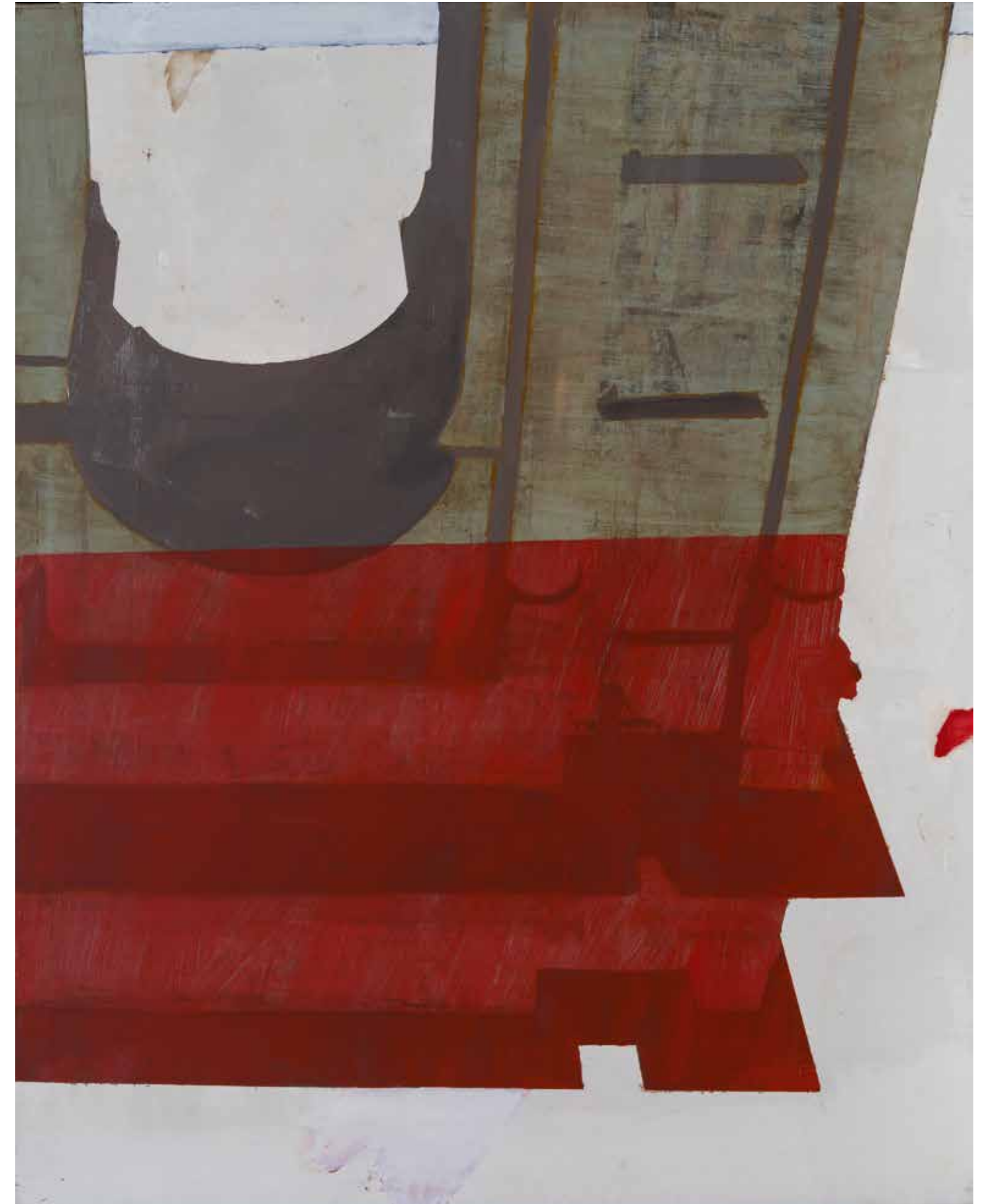
Империя, 2021, акрил, платно, 150x120x3 см Empire, 2021, acrylic, canvas, 150x120x3 cm