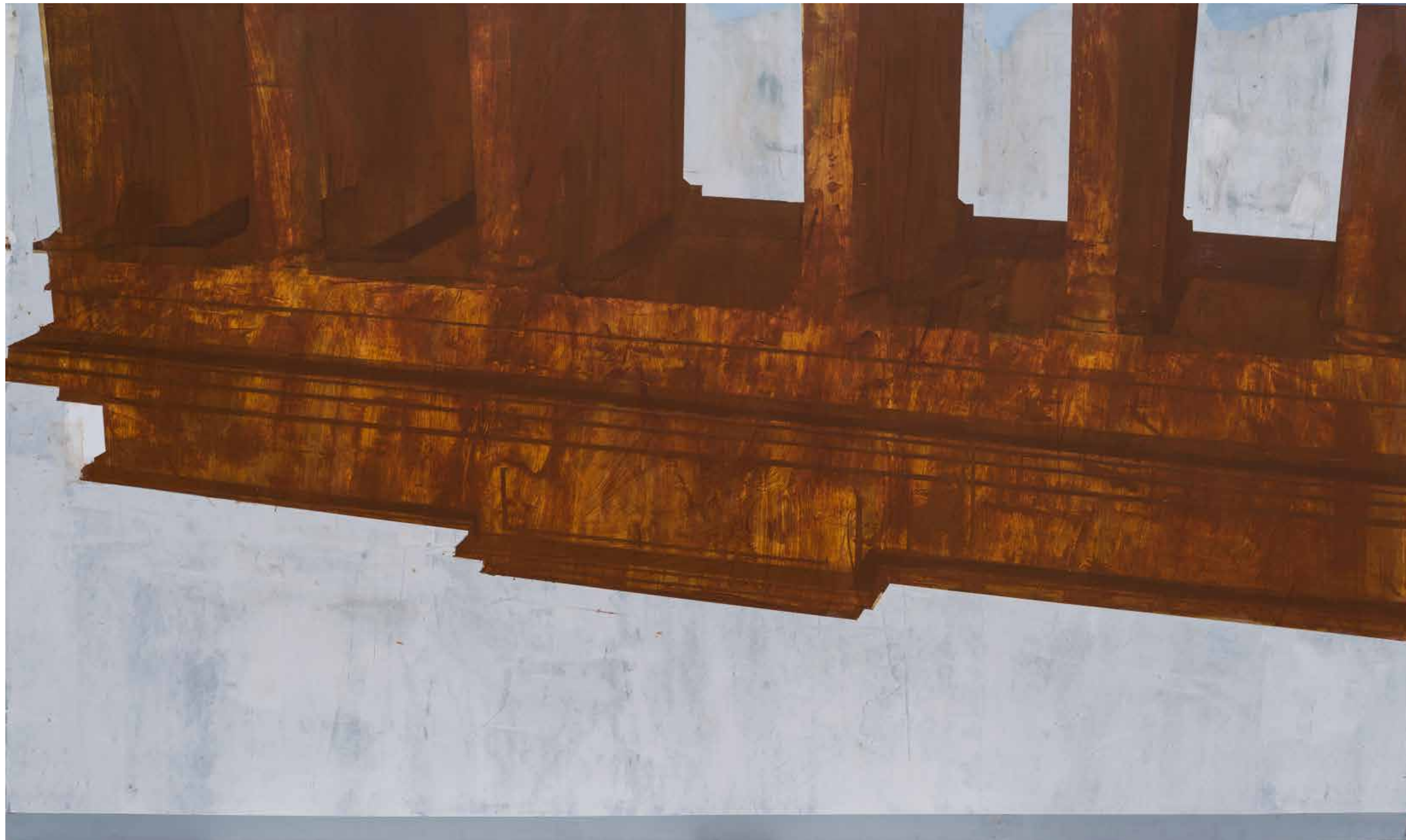
Здание, 2021, акрил, платно, 180x300x3 см Building, 2021, acrylic, canvas, 180x300x3 cm