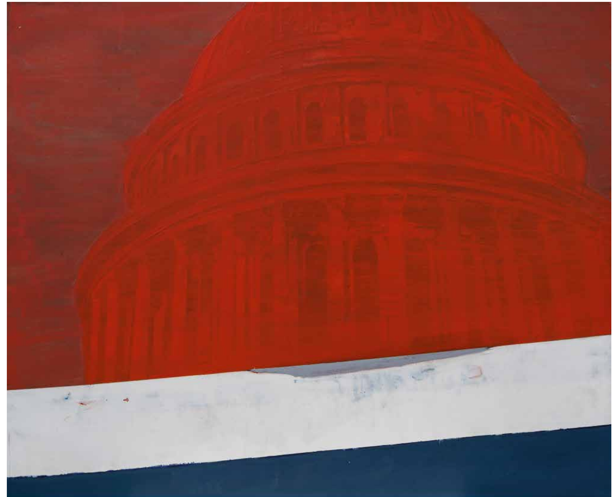
Ротонда, 2020-21, акрил, платно, 150x180x3 см Rotunda, 2020-21, acrylic, canvas, 150x180x3 cm