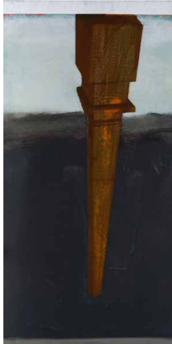
Обелиск, 2020-21, акрил, платно, 120x60x3 см Obelisk, 2020-21, acrylic, canvas, 120x60x3 cm