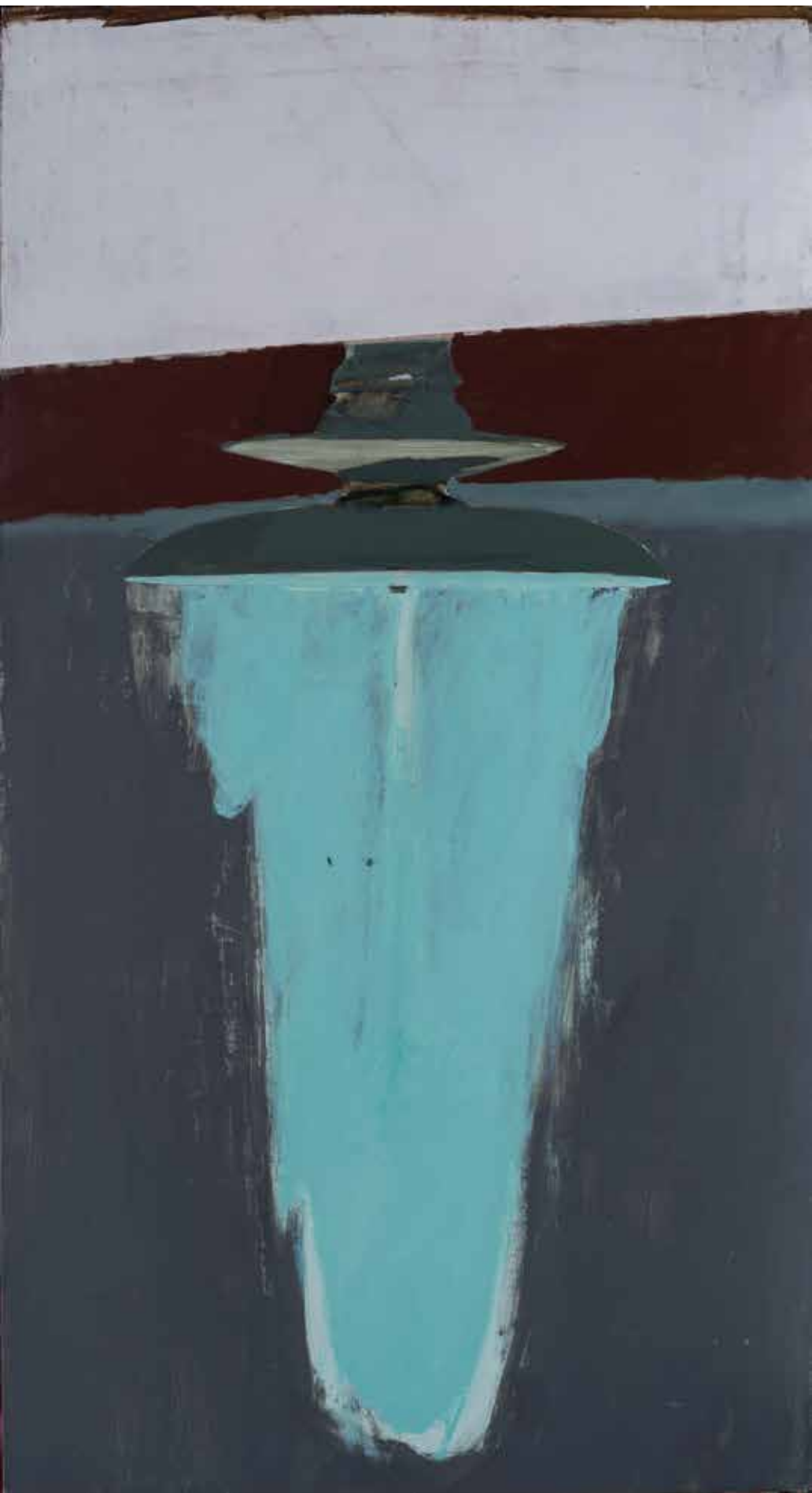
Фонтан, 2021, акрил, платно, 180x95x3 см Fountain, 2021, acrylic, canvas, 180x95x3 cm