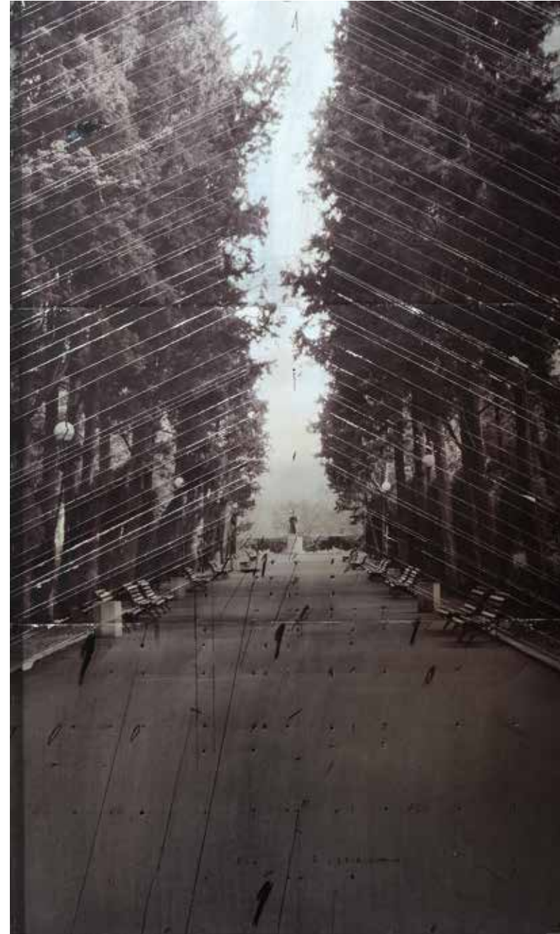
Алея Пушкин II, 2015, дигитален принт върху офсетова плака, интервенция, черен молив, 150x90 см Pushkin Alley II, 2015, digital print on offset plate, intervention, black pencil, 150x90 cm

В следващите две години Иво Бистрички търси по-директни начини да коментира света, в който живеем: инсталацията от знамена „Единство и сплотеност“ в рамките на фестивала „За хората и мястото“ в Западен парк, София, 2012 г., както и проекта “UTOPIA. EURASIA” в Софийски Арсенал – Музей за съвременно изкуство, София през 2013 г. Една от най-силните истории, които художникът разказва е в цикъла „Наследство“, 2014 – два портрета на фона на Нефтохим, Бургас, които отварят темата за починали от ракови заболявания дългогодишни работници в предприятието. Проектът „Апокалиптични пейзажи“, представен през същата година в Suspaciuous, София, показва атомната бомба, като образ на злото, но и причините за поражането на това зло. Политическата власт тук играе основна роля, олицетворена чрез разпознаваеми сгради-монументи на управлението.