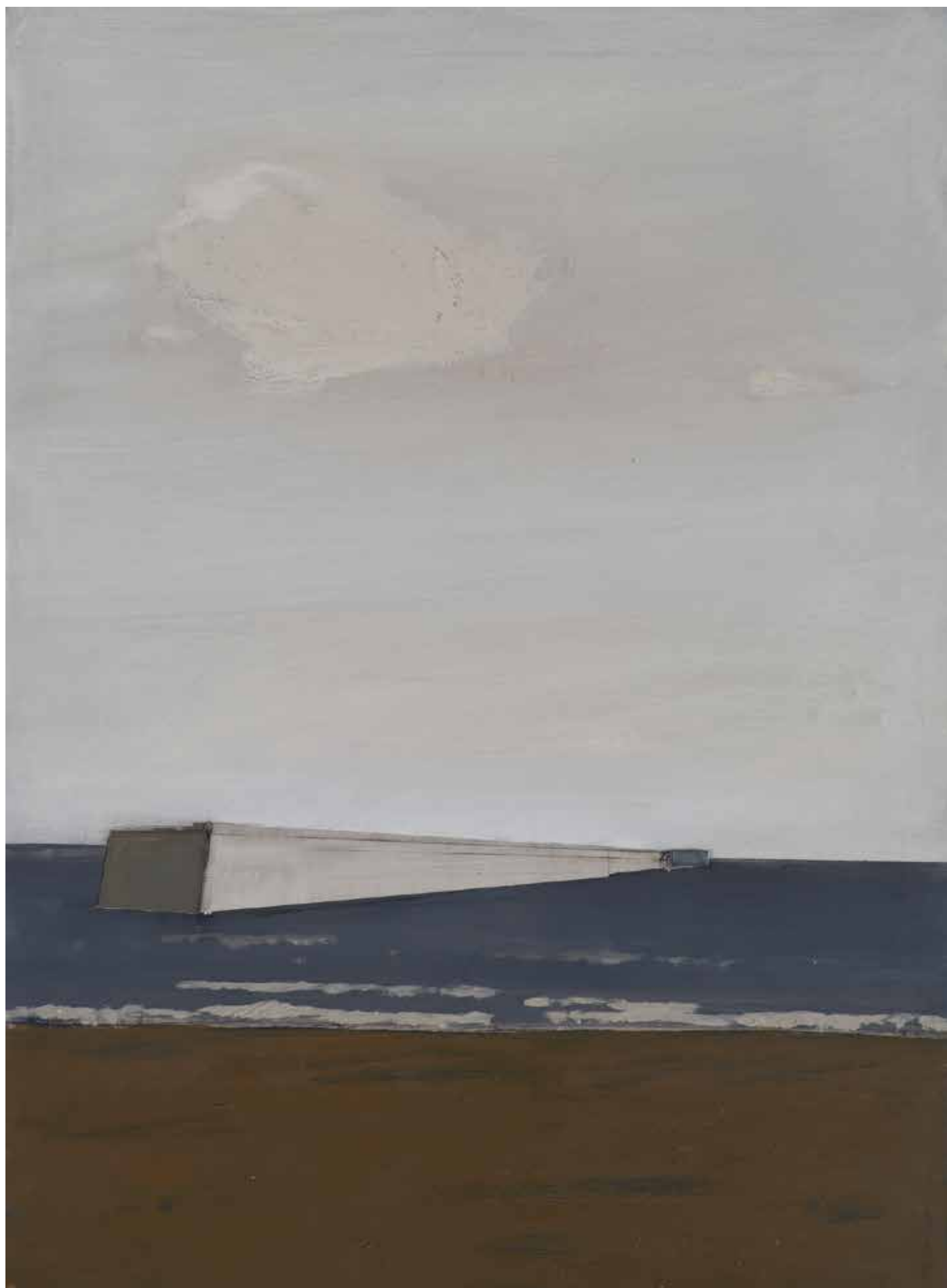
< Платформа, 2017, акрил, платно, 120x90 см Platform, 2017, acrylic, canvas, 120x90 cm

последните 20 години опитите за промяна са безуспешни и надеждата е изчерпана. Все по-малък става шансът индивидът да се противопостави на системата.