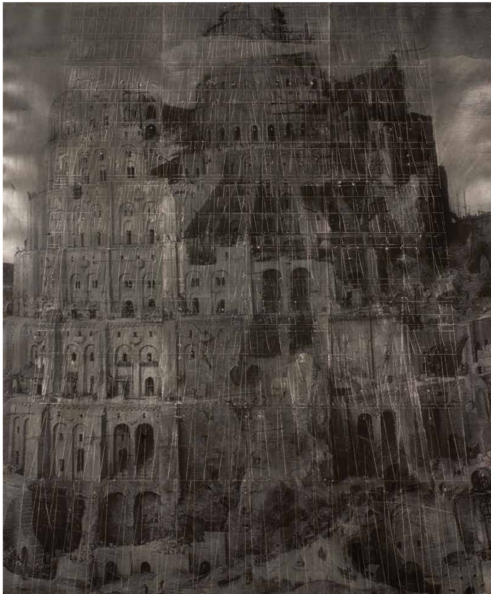
< Утопия I, 2009, дигитален принт, интервенция, офсетова плака, 180x150 cm Utopia I, 2009 x digital print, intervention, offset plate, 180x150 cm