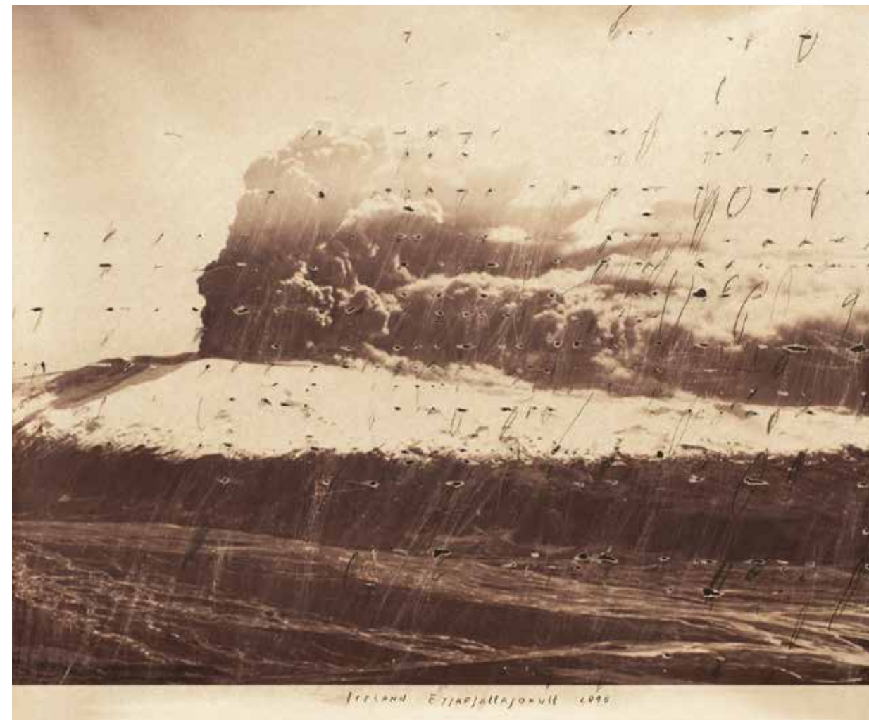
Перфорация на пейзажа II, 2010, дигитален принт върху офсетова плака, интервенция, креда, 140x210 см Landscape perforation II, 2010, digital print on offset plate, intervention, chalk, 140x210 cm