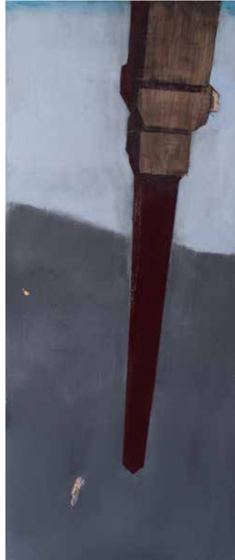
Обелиск, 2020-21, акрил, платно, 120x50x2 см Obelisk, 2020-21, acrylic, canvas, 120x50x2 cm