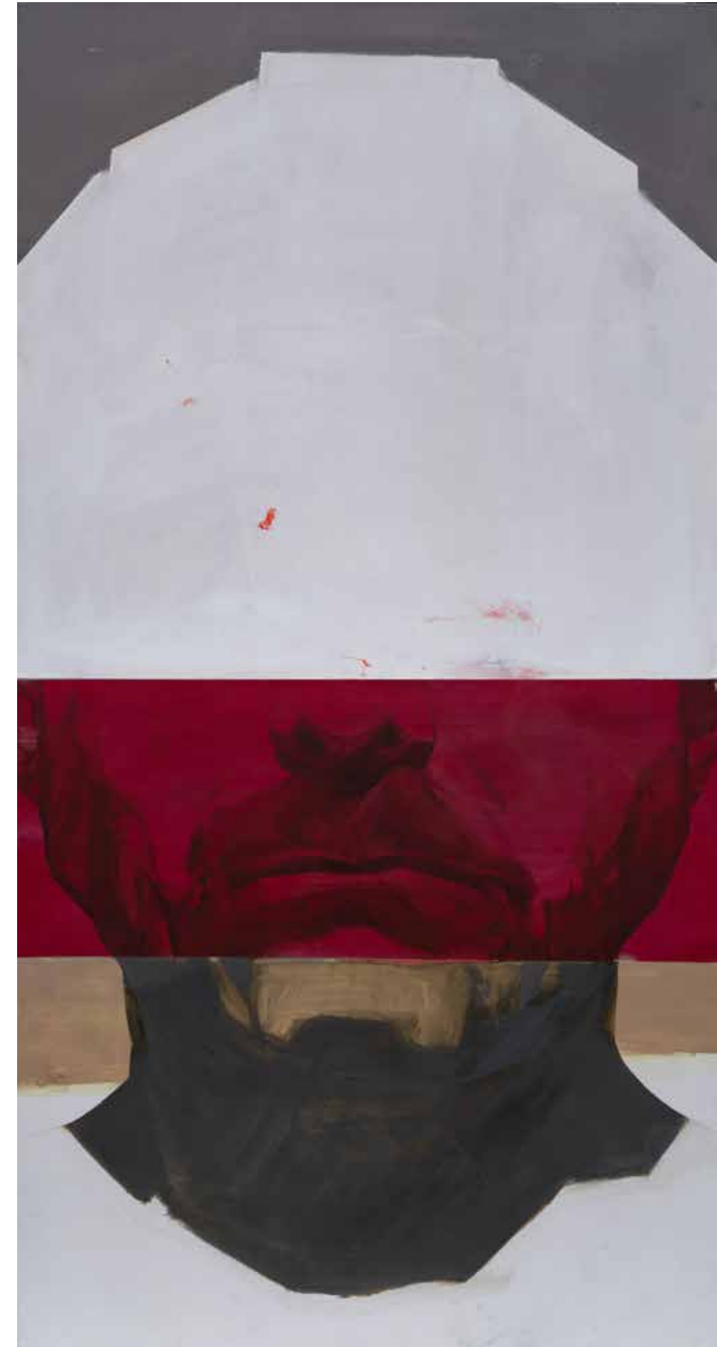
Цитаделата, 2021, акрил, платно, 240x120x3 см The Citadel, 2021, acrylic, canvas, 240x120x3 cm