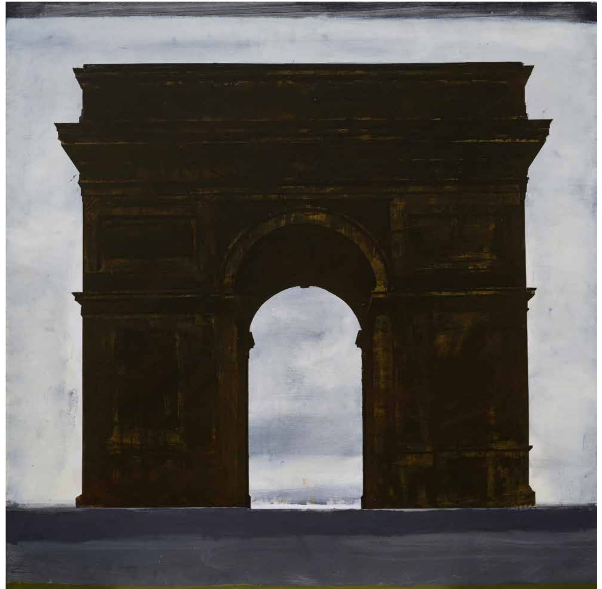
Арка, 2020-21, акрил, платно, 180x180x3 см Arch, 2020-21, acrylic, canvas, 180x180x3 cm