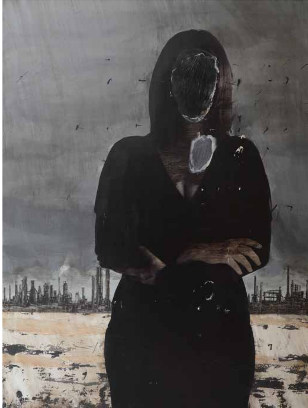
Наследство, 2014, дигитален принт, акрил, молив, платно, 120x90 см Картината се посвещава на бившите работници на Нефтохим. Legacy, 2014, digital print, acrylic, pencil, canvas, 120x90 cm The picture is dedicated to former workers of Neftochim.