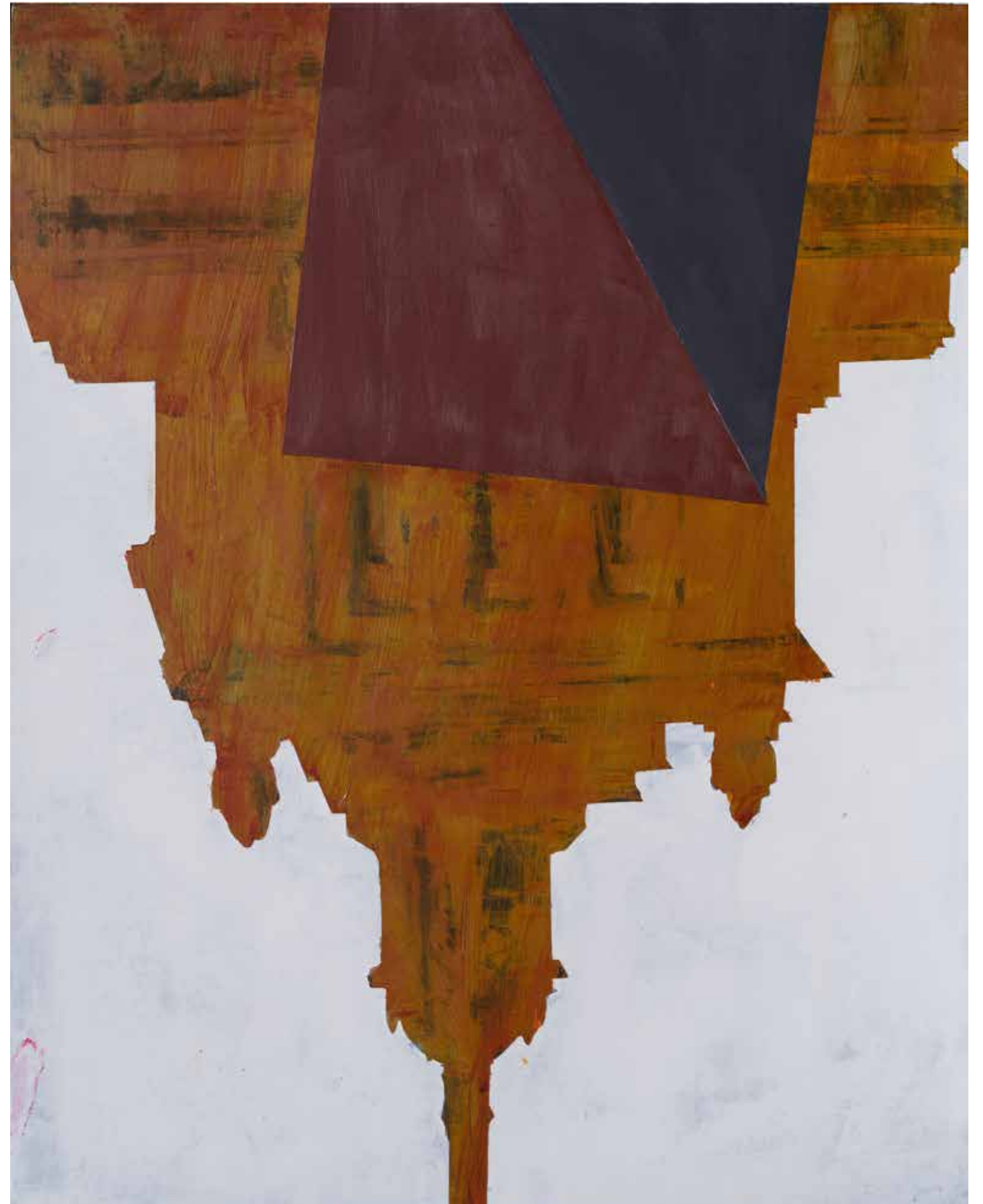
Дворец, 2021, акрил, платно, 150x120x3 см Palace, 2021, acrylic, canvas, 150x120x3 cm