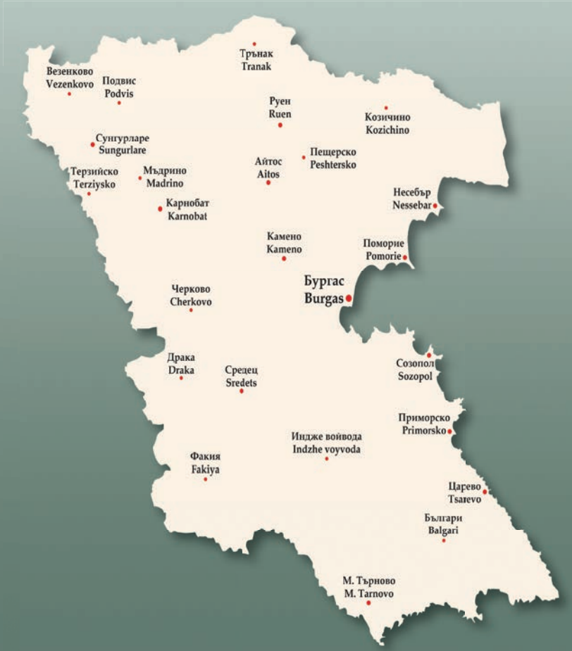
Карта на Бургаски регион

Настоящият каталог цели да покаже местното своеобразие на традиционните дрехи – тъкани, кройка, декорация, цялостен облик на композицията и колорит. Дори отделни детайли на украсата имат важна роля в създаването на локалните разновидности на носии. Подбрахме неголяма, но представителна част от фонда на отдел „Етнография“ при Регионален исторически музей Бургас, които да илюстрират това изключително многообразие на варианти и особености на традиционното облекло на местното население, както и на преселниците, без претенции за изчерпателност и окончателни обобщения... Всеки изследовател е срещал противоречиви или случайни названия на дадена дреха, отделна нейна част или елемент от декорацията. Тук се придържахме към общоприетите наименования, а когато разполагаме с конкретна информация от дарителя или притежателя, посочваме и нея.