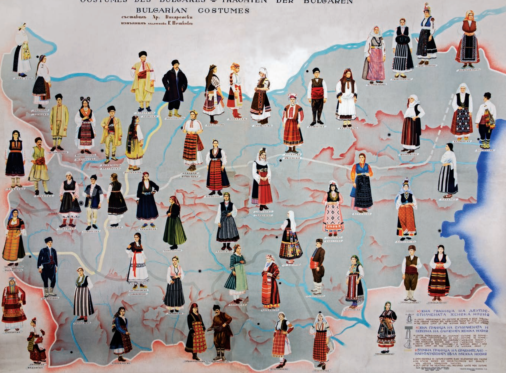
Карта на български народни носии от 1942 г., съставена от Христо Вакарелски, художник: Г. Петков

съставилъ Хр. Вакарелски изложилъ Анастоль Г. Петковъ