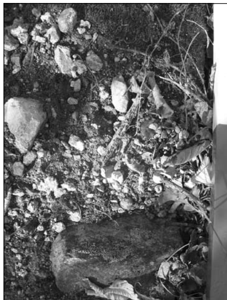
Обр. 6. Следи от хоросан сред камъните на западната крепостна стена.