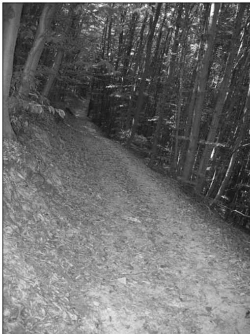
Обр. 15. Пътят по северните склонове на Витоша.

лето“. Вторият наблюдателен пункт се намира в местността „Градище“.