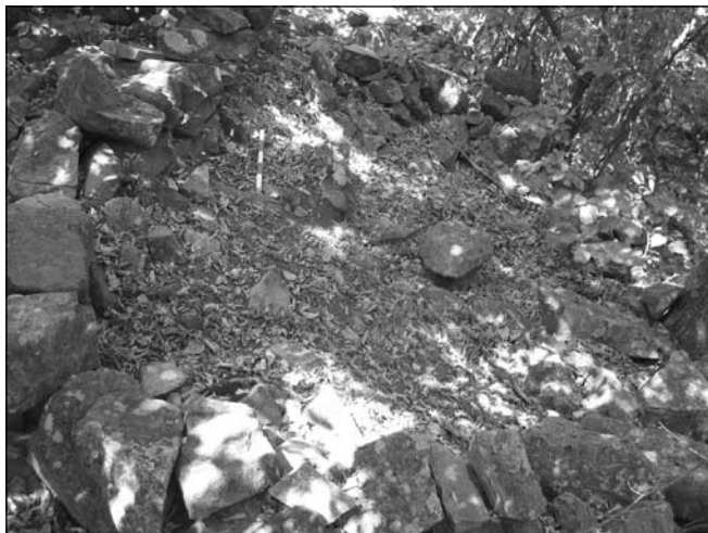
Обр. 9. Иманярски изкоп в южната част на укреплението.