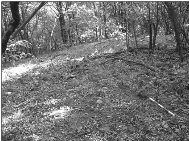
Обр. 14. Останки от ъгъл на масивна сграда в местността „Градище“.