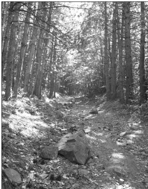
Обр. 8. Пътят по северните склонове на Витоша.

Интерес предизвиква фактът, че от изток възвишението не е било изцяло защитено от стена. Това очевидно е поради съществуващият тук много голям естествен наклон на терена, препятстващ възможността за нападение от тази посока. Само от