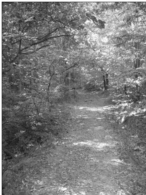
Обр. 7. Пътят по склона на местността „Калето“.