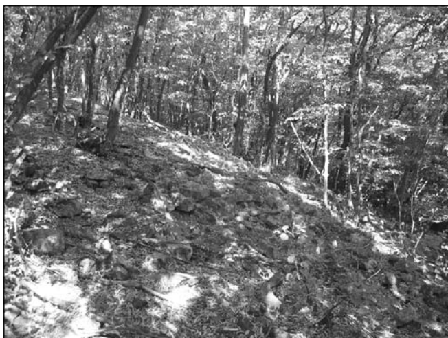
Обр. 12. Останките от източната крепостна стена, които се проследяват като разсип по източния склон на възвишението.

Едно от съображенията ни е наличието на други подобни укрепления в региона. Съществуващата и днес над Бояна, крепост в местността „Момина скала“ е с почти идентичен план, размери и начин на градеж. И тя, както и тази в местността „Калето“ над Драгалевци стои във връзка със специално изграден път в планината. Преди време имаме възможност да направим наблюдения на място и въз основа на това да обосновем времето на изграждането ѝ в периода XIV–XV в 2 . Описания на сходно по характер укрепление, отне-