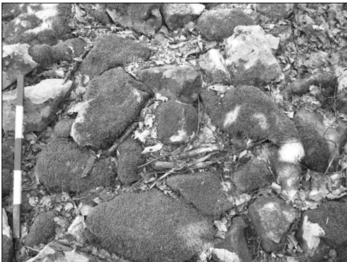
Обр. 5. Камъните от пълнежа на крепостната стена. Детайл.