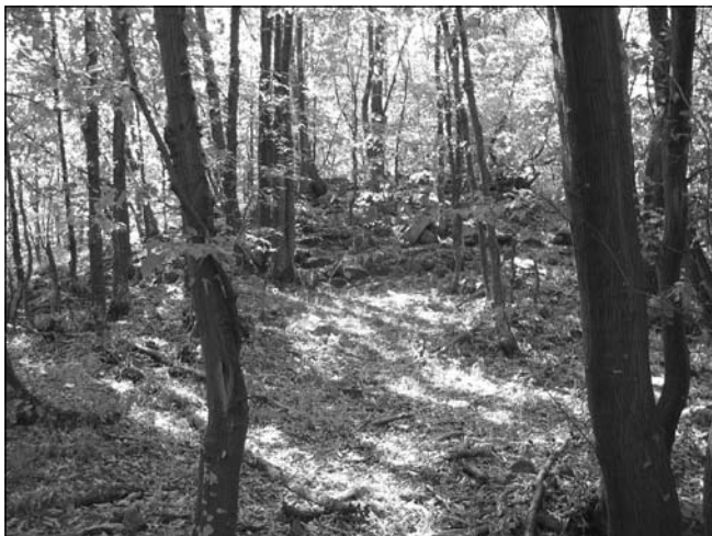
Обр. 11. Деструкциите от кулата в южната част на укрепението в местността „Калето“. Поглед от север.