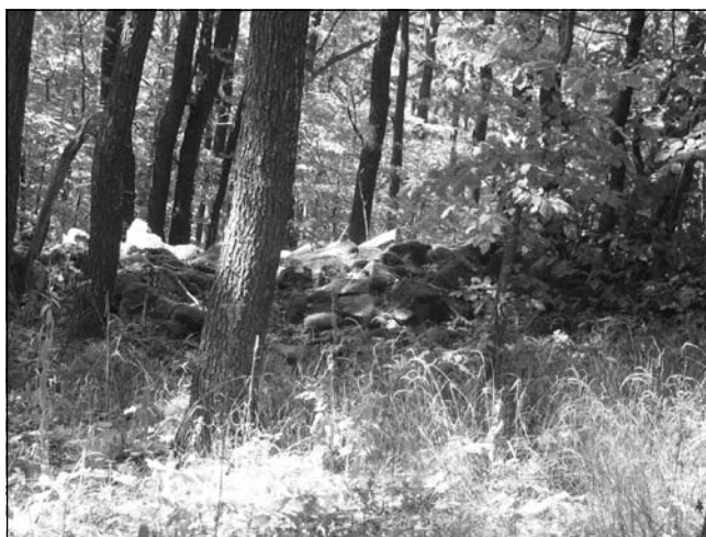
Обр. 3. Западната крепостна стена. Останките от нея се виждат като вал от ломени камъни на повърхността. Поглед то изток.