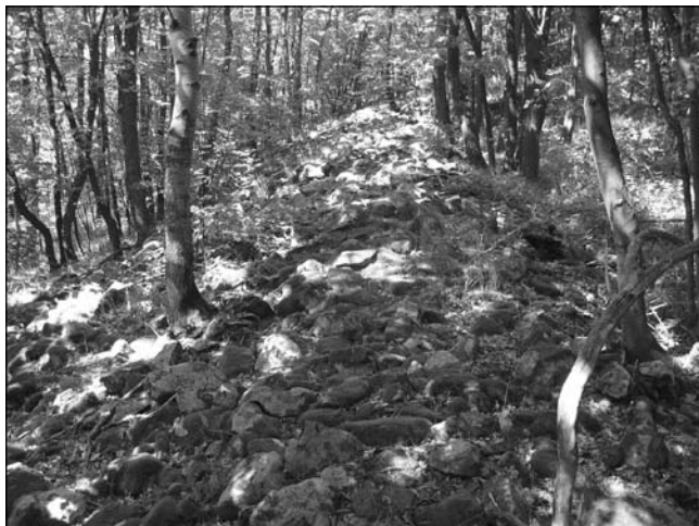
Обр. 2. Западната крепостна стена в местността „Калето“. Поглед от юг.