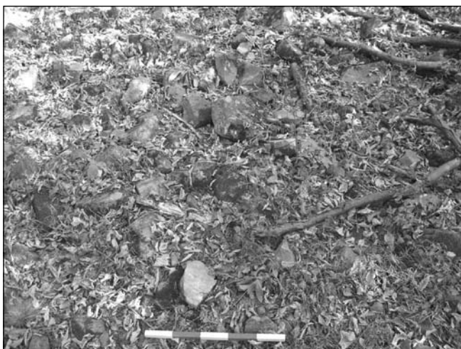
Обр. 13. Деструкции от зидове в местността „Градище“.

ка с който е изградено и функционирало укрепението в местността „Калето“ при Драгалевци, отвежда и до Драгалевския манастир и до Бояна. Както е известно и Драгалевци и Бояна са села, чието съществуване е регистрирано още в средновековието. А създаването на Драгалевския манастир „Св. Богородица Витошка“, се свързва недвусмислено с управлението на цар Иван Александър (1331–1371), посочен като основател и украсител на манастира, във Витошката дарствената грамота на цар Иван Шишман 5 . От това време,