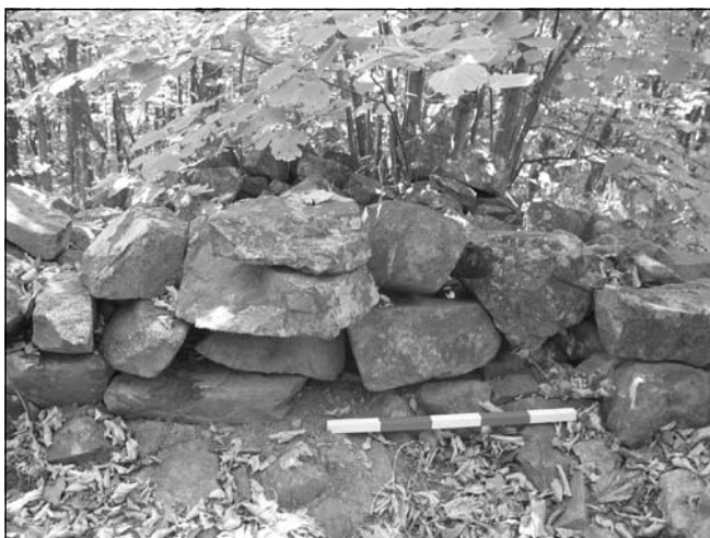
Обр. 10. Извадените от иманярския изкоп камъни, натрупани като градеж.

Този факт, както и сравнително ограничените размери на укрепената площ, не особено прецизния характер на градежа на укрепителните съоръжения и липсата на следи от трайни постройки във вътрешността на пръв поглед навежда на мисълта, че калето е било използвано само като временно убежище при нападение. Но тогава изглежда странно наличието на добре устроен планински път, който отвежда директно до него. По-вероятно е този укрепен пункт да е изграден именно във връзка с охраната и контрола на