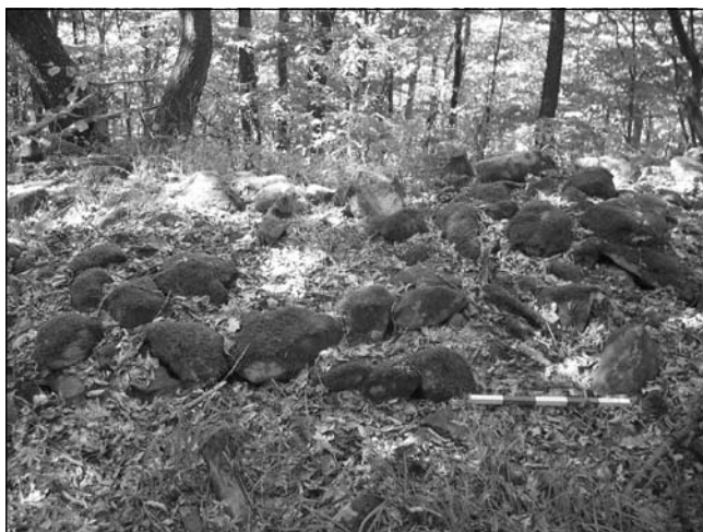
Обр. 4. Камъните от вътрешното лице на западната крепостна стена.