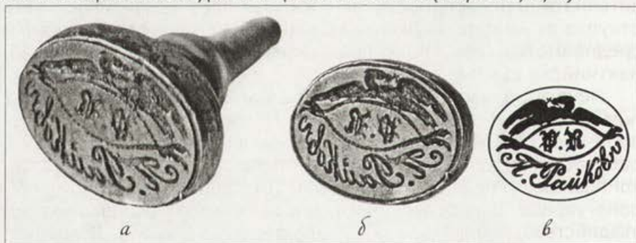
Обр. 4. Личен печат на Петър Райков

Описание: Елипсовиден релефен печат, плътък релеф за графичен тушов отпечатък. Състои се от две части: метална и дървена. Металната включва печатаща повърхност и добре оформен корпус с резба, предназначена за монтиране на липсващата поддържаща част (дръжката). Печатът има обща височина 37 мм; височина на работната плочка 5 мм и диаметър 17/24 мм. В центъра на изобразителното поле са гравирани като монограм името и фамилията на притежателя на печата. Буквите са леко удължени, калиграфски оформени, с височина 3 мм. Тънка връзана линия във формата на елипса рамкира и откроява централната композиция. Надписът в негатив "П. Райков" е разположен в полукръг, по периферията на работната повърхност в долния и край. Буквите са ръкописни, калиграфски оформени с височина 2 мм и 5 мм. В горната част на изобразителното поле е гравирана фигура на птица: орел с разперени криле, държащ в клюна си християнски кръст. Тънка връзана линия очертава контурите на работното поле (Обр. 4 а, б, в).