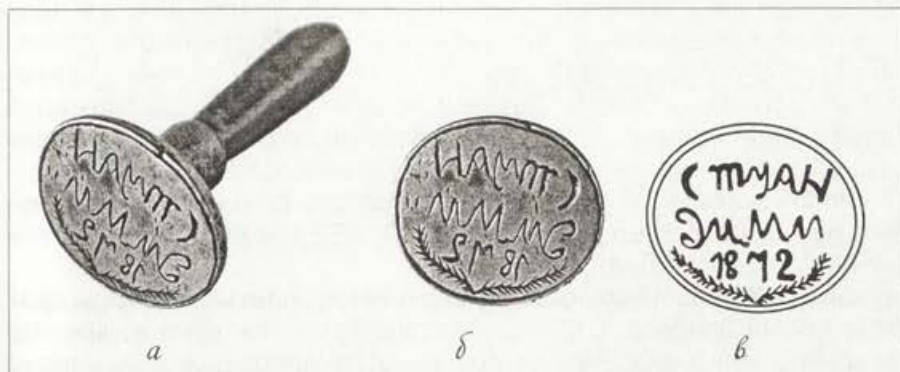
Обр. 3. Личен печат на Стоян Димитров

украза от лавров венец, гравирани в долната част на печата, и тънка контурна линия по периферията. Украсата е силно стилизирана (Обр. 3 а, б, в).