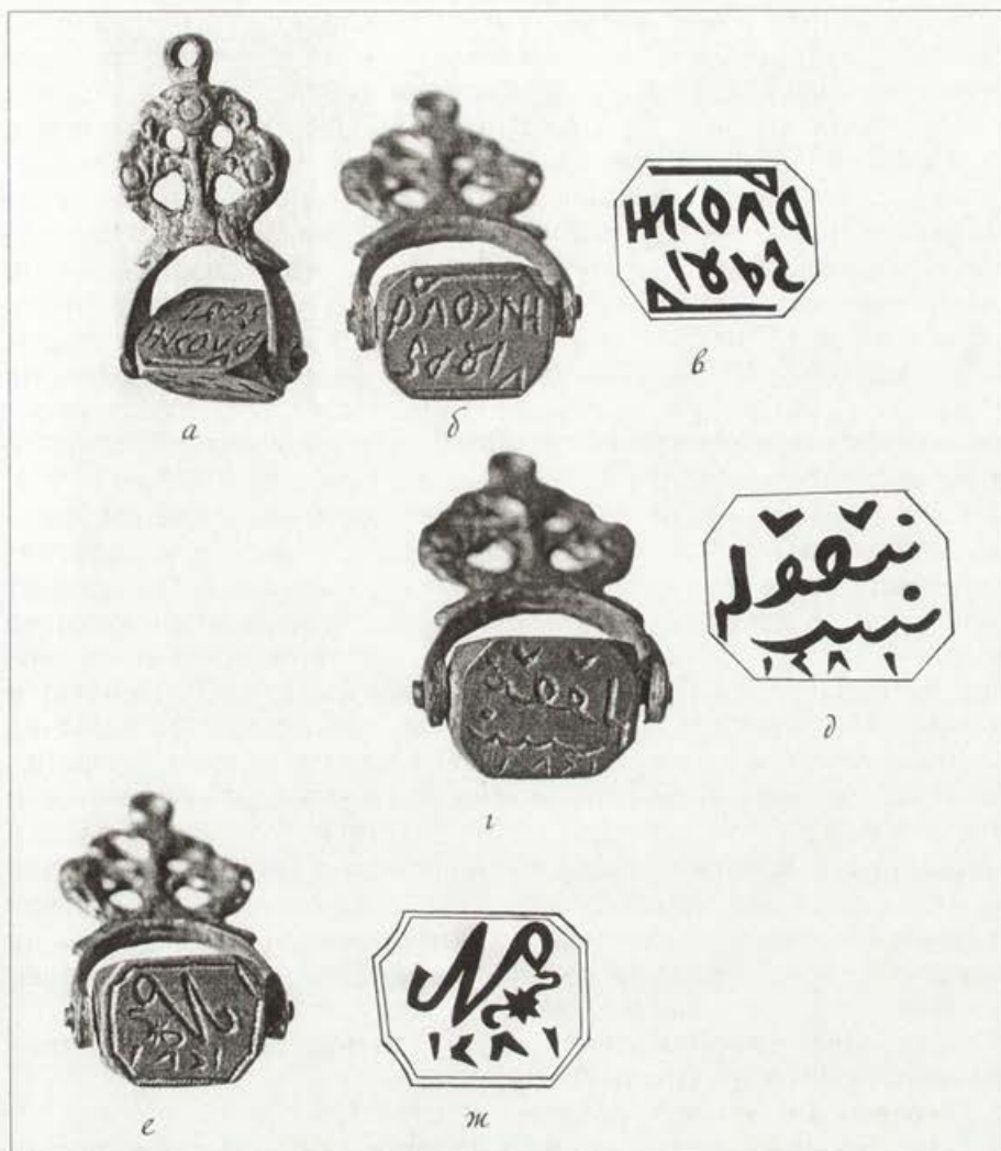
Обр. 2. Троен комбиниран печат на Никола