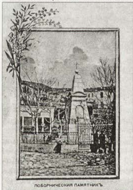
Обр. 6. Паметника на обесените. Издание на Ив. Владов, 1901 г.

В края на XIX и началото на XX в. той се утвърждава като първоразряден книговец и добър издател. Стопанин е на месечното литературно-научно списание "Звезда", съдейства за издаването на месечното литературно списание "Труд". Речниците, художествената литература, историко-философските съчинения са преводни от руски и френски, или авторски на Моско Москов. Заради отзивчивостта, трудолюбието му, обществено-полезната му дейност, два пъти е избран за кмет на В. Търново – 1908–1911 г., 1919–1920 г.