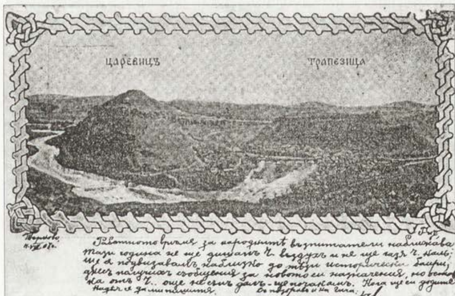
Обр. 13. Царевец и Трапезица (рисунка). Издание на ТД "Трапезица", 1907 г.