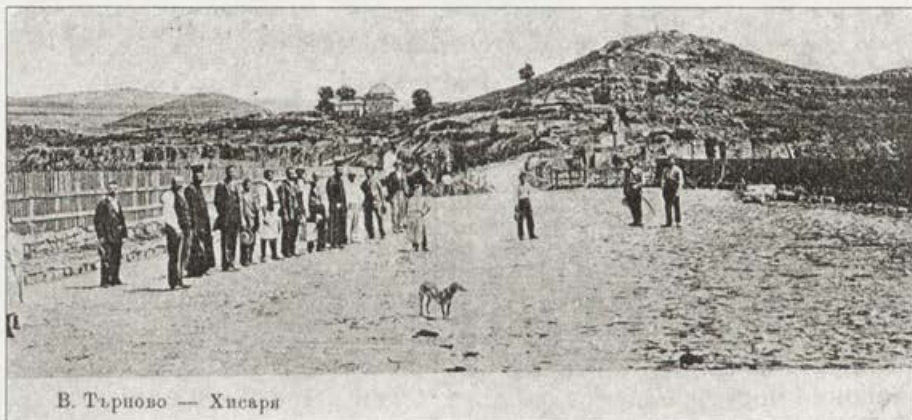
Обр. 4. Площада пред Хисаря (Царевец). Фотограф и издател А. Бронфен – 1901 г. Vorb. 4. Der Platz vor Hissaria (Zarevetz). Fotograf und Herausgeber A. Bronfen – 1901.

си дейност, може би изпитвайки конкуренцията на професионалните издатели, които са и разпространители.