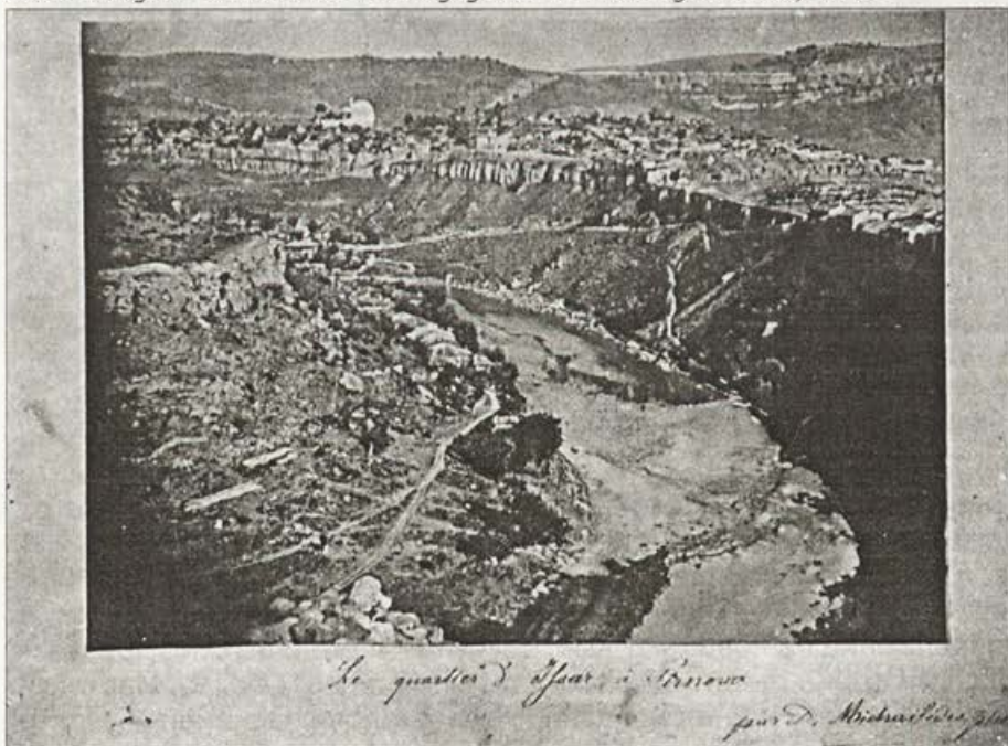
Обр. 9. Изглед от Хисаря през 1875 г. Издание на Ив. Ферманджиев – 1903 г.

Vorb. 8. P. Gargaritshev vor seinem eigenen Laden nach dem Erdbeben im Jahre 1913. Herausgegeben von P. Gargaritshev, 1913.