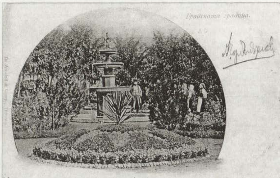
Обр. 3. Градската градина с шадравана. Фотограф и издател Д. Василев – 1900 г. Vorb. 3. Der Stadtpark mit dem Springbrunnen. Fotograf und Herausgeber D. Wasilev – 1900.