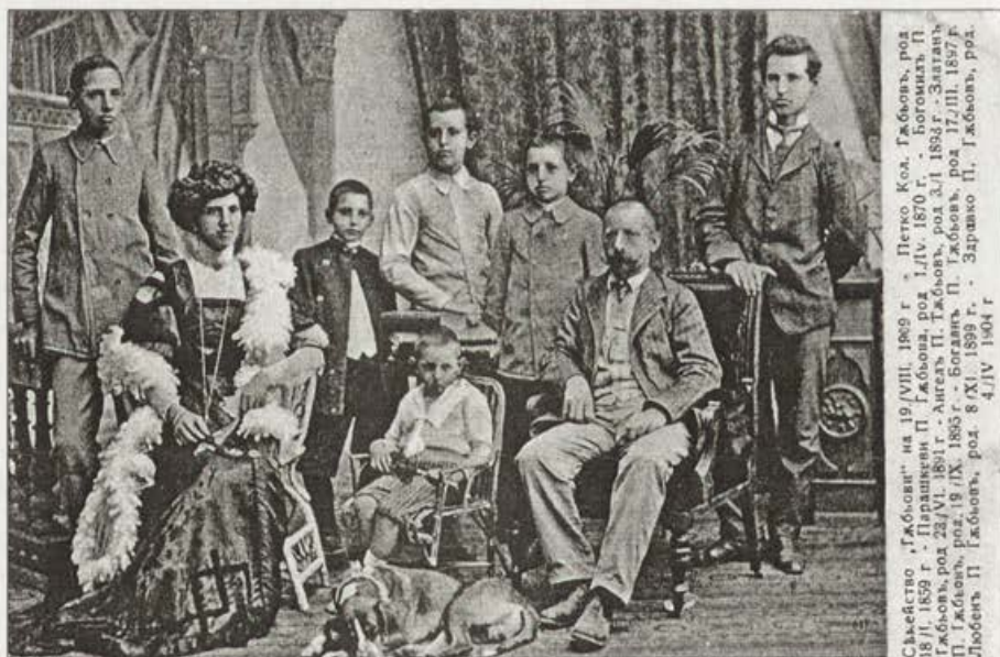
Обр. 12. Семейството на П. Гъбов. Фотограф и издател – Ц. Хараламбиев – 1909 г.

Vorb. 11. Handelsstraße. Fotograf – A. Bronfen. Herausgegeben von "Noev und Mintschev".