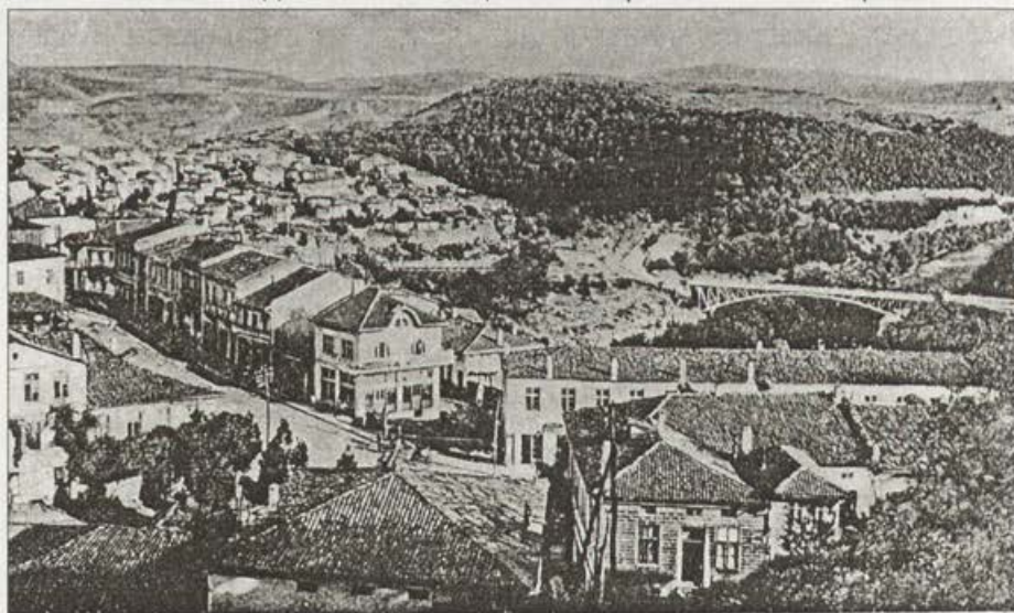
ТЪРНОВО ИЗГЛЕД ОТ КАРТАЛА

Към природните красоти на В.Търново, архитектурата, историческите забележителности, новото строителство, земетресението от 1913 г. и други събития проявяват интерес фотографи и издатели на пощенски картички от Русе и София. Между тях трябва да споменем русенците: Г. Дукас, Е. Алкалай, Стефан Кънев, Д. Версано, Ст. Балаш и софийските фотографи: Парлапанов, Олчев, И. Баждаров, известните само с инициалите си Р.У.Д., И.К.Б., В.К.В, фото "Еклер" и особено Гр. Пасков. Последният започва с издаване на снимки от търновски фотографи, а впоследствие, заедно със сина си, и на многобройни собствени заснемания (Обр. 14). През 30-те години на ХХ век двамата са най-големите издатели на пощенски картички в България.