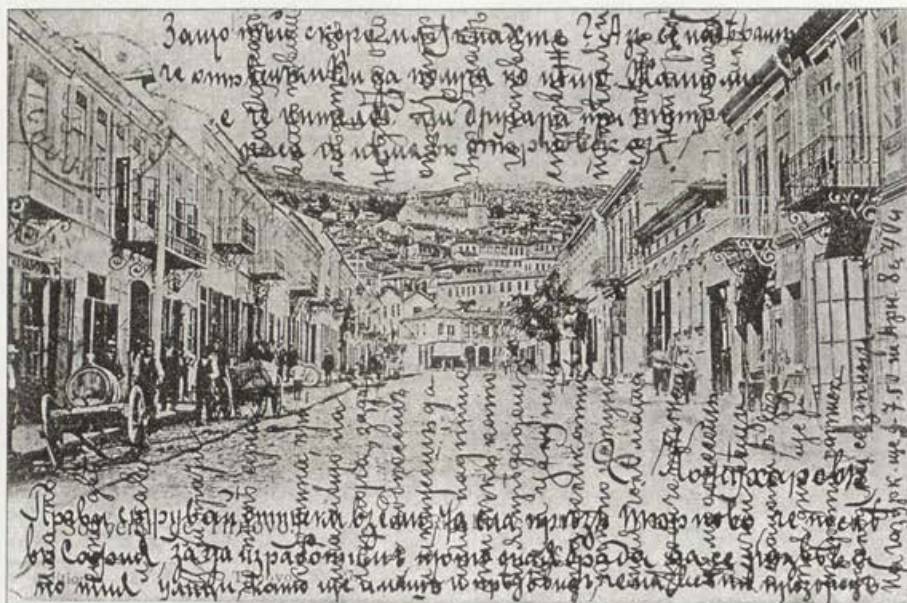
Обр. 11. Улица "Търговска". Издание на "Ноев и Минчев".

Vorb. 11. Handelsstraße. Herausgegeben von "Noev und Mintschev".