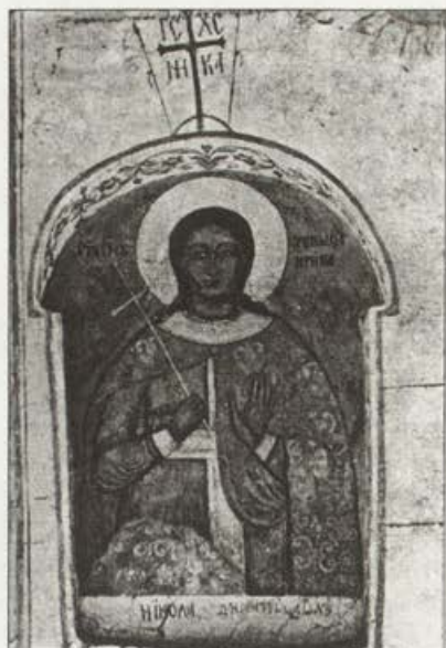
Обр. 6. Света Великомъченица Ирина.