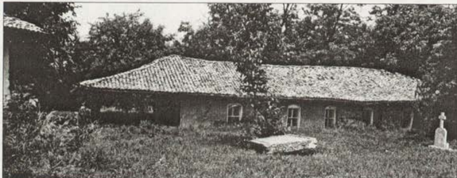
Обр. 3. Сградата на църквата "Св. Великомъченица Ирина" и жертвеният камък.