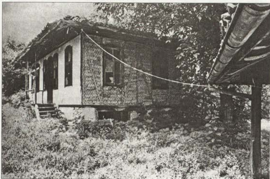
Обр. 2. Сградата на метоха на Рилския манастир.