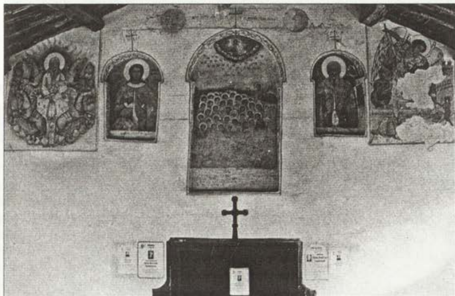
Обр. 5. Запазените стенописи над входа.