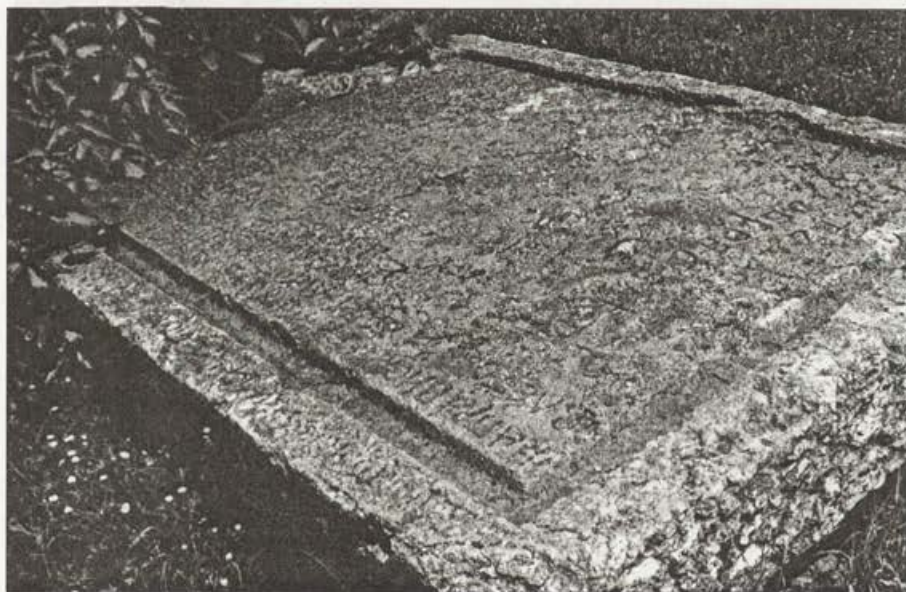
Обр. 1. Жертвеният камък с надпис.

Църквата "Св. Великомъченица Ирина" е построена през 1836 г. За това узнаваме от надпис, издълбан върху голям жертвен камък, поставен в църковния двор и пригоден за извършване на църковни служби. Той има размери: дължина 2,32 м и ширина 1,72 м, от всички страни обграден с издълбани улеи с ширина 0,08 м. В единия край камъкът се стеснява, улеите се приближават и образуват място за изтичане на кръвта на жертвеното животно ( Обр. 1 ). Надписът съобщава, че преди построяването на храма, в двора на църквата е имало метох на Рилския манастир. Сградата на метоха и до ден днешен е запазена западно от църквата ( Обр. 2 ). Надписът е изсечен от известния на времето таксидиот на Рилския манастир Гаврил Рилец. Дело на същия автор е икона с надпис и означение на годината 1836.