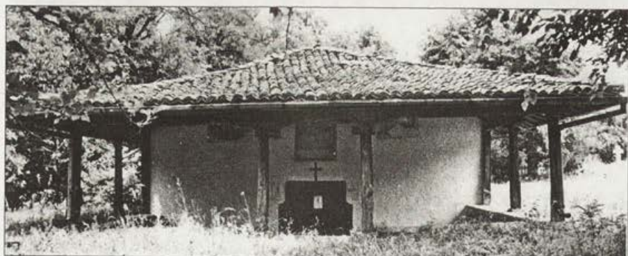
Обр. 4. Входът и западната фасада на църквата с открития притвор. Виждат се част от стенописите над входа от ранния живописен слой.