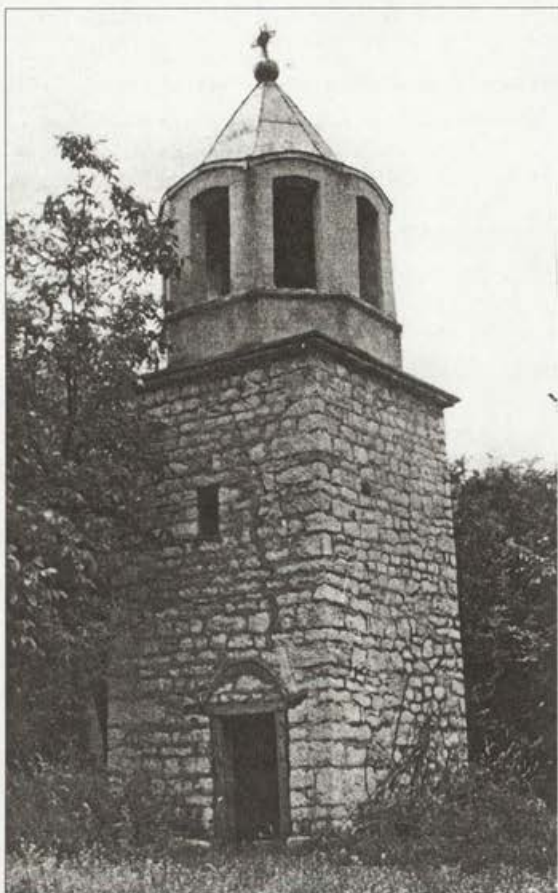
Обр. 8. Квадратна кула камбанария към църквата.

2. Книга с протоколи и постановления по ремонта и реставрацията на църковното имущество и контракти между настоятелството и майстори зидари. Обхваща периода от 22.10.1896 година до 28.08.1933 година. Съдържа 11 листа (ТД "ДА" – Велико Търново, ф. 577 К, оп 1, а. е. 1.). Тук можем да прочетем, че през 1896 година е взето решение за отпускане на 600 лева за поправка на стаята на църковната баба (ТД "ДА" – Велико Търново, ф. 577 К, оп 1, а. е. 1., л. 1). През 1904 година настоятелството гласува 800 лева за поправка на църковара и оградата на църковния двор (ТД "ДА" – Велико Търново, ф. 577 К, оп 1, а. е. 1, л. 2). През 1906 година са гласувани 300 лева за построяване-