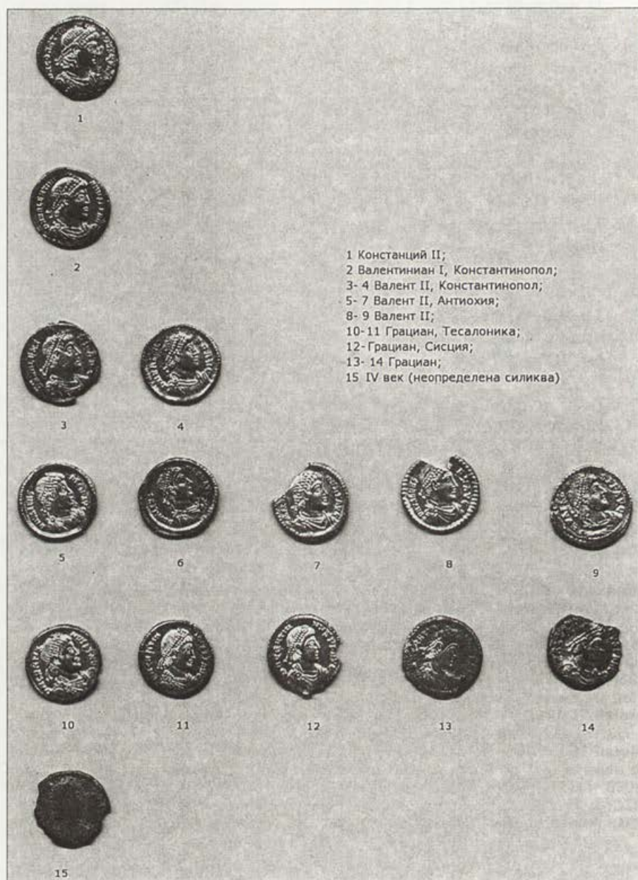
Обр 1. Находка от силикви от Некропола на Августа Траяна (аверси)