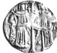
Обр. 10–16. Аспри на Иван Александър с Михаил Асен, вариант В