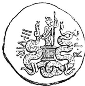
Фиг. 4. Двойка змии върху цистофор на Марк Антоний с Октавия от 39 г. пр. Хр.