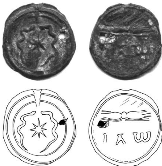
Фиг. 1. Оловен гностически амулет от СЗ България.