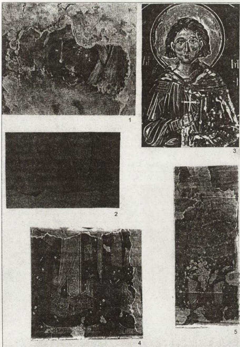
Обр. 1. Стенописи от В. Търново – фрагменти, XIII–XIV в.

1. Стенопис от Двореца. 2. Св. Симон от "Св. св. Петър и Павел". 3. Стенопис от Трапезица. 4. Царски портрет – долната част, Трапезица 5. Неизвестен светец от Трапезица.