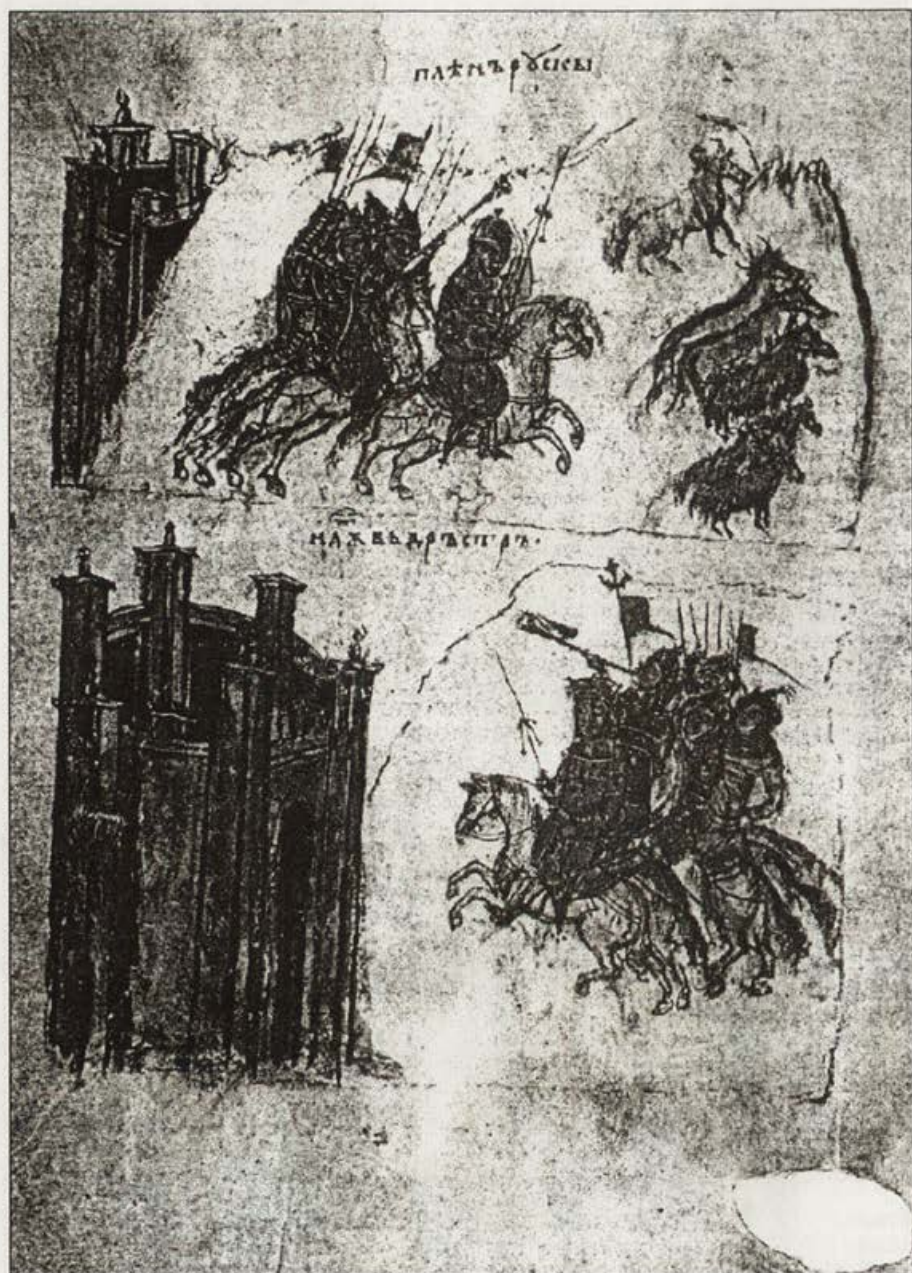
Обр. 2. Миниатюра от Манасиевата летопис – 1345 г. Светослав Киевски навлиза в българските земи и Похода към Силистра