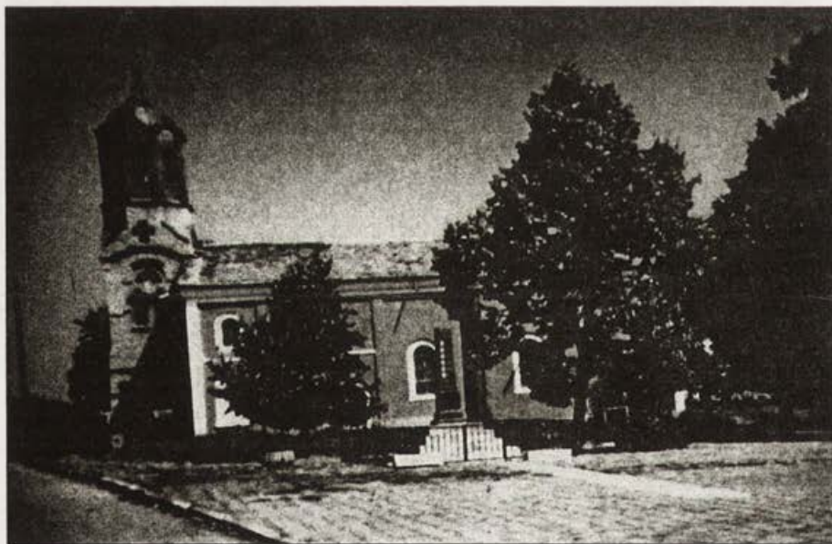
Обр. 1. Храмът "Св. Йоан Рилски"

Малко са храмовете в Отечеството ни, които могат да се похвалят с дълга история. Тук, в сърцето на България, недалеч от Велико Търново, се намира прекрасната и запазена сграда на църквата "Св. Йоан Рилски" с красива камбанария, привличаща всичката светлина на слънцето, ремонтирана, реставрирана и предизвикваща всеки да се почувства горд, че е българин, че е балванчанин, че е дал своята лепта за съграждането и запазването ѝ ( Обр. 1 ).