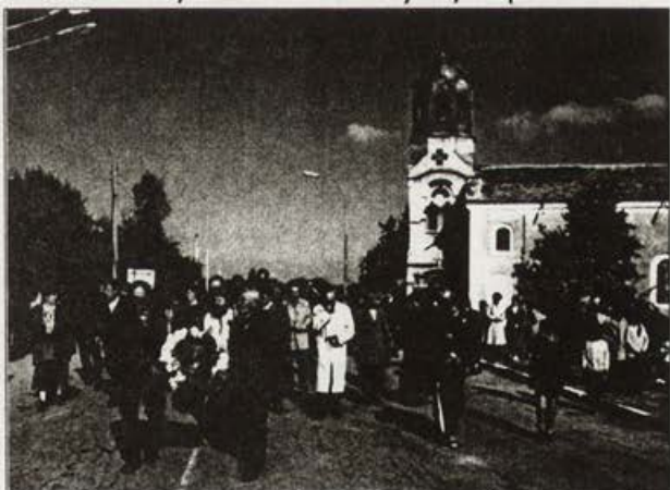
Обр. 3. Изнасяне на иконата на "Св. Йоан Рилски" от църквата по време на храмовия празник, Балван, 2001 г.

Днес, все така величествена, с позлатено кубе, черквата "Св. Йоан Рилски" в с. Балван – художествен и архитектурен паметник на културата от местно значение и символ на приноса на селото към българската култура – продължава да е опора на българската вяра и българския дух (Обр. 3).