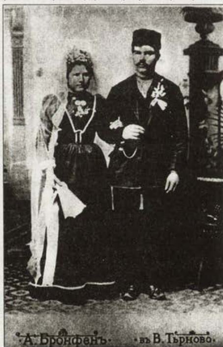
Обр. 18. Сватбена снимка на градинар-гурбетчия от с. Миндя

Освен като фотограф, през 1890 г. Бронфен започва да се изявява като пропагандатор на природните и архитектурни забележителности на Търново.