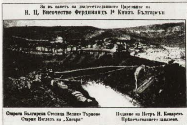
Обр. 6. Панорама на Царевец. Пощенска картичка по снимка на Д. Михайлидес

ретуша и оцветяването обаче, панорамата е загубила от документалността си и създава впечатление, че е рисувана. В частни колекции са запазени няколко документиранни снимки, правени в България през 1875 г. Вероятно през тази година е снимал в Търново и Д. Михайлидес.