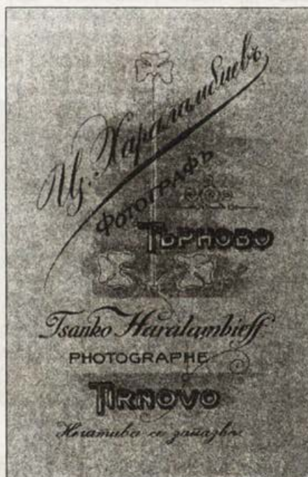
Обр. 27. Фирмен картон на Ц. Хараламбиев, 1909 г.