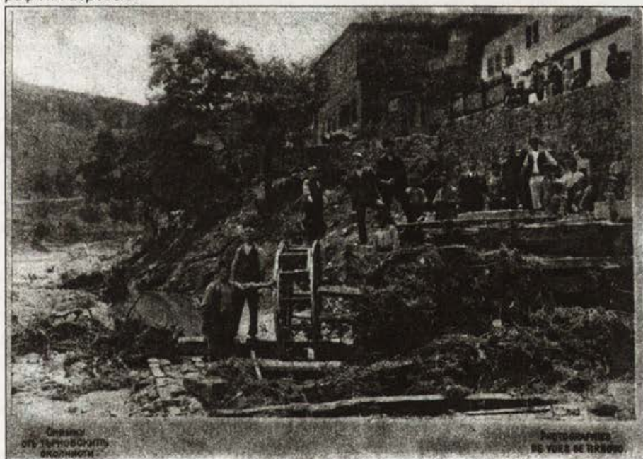
Обр. 16. Разрушена мелница след наводнението на 2 август 1897 г., ф. Е. Либих