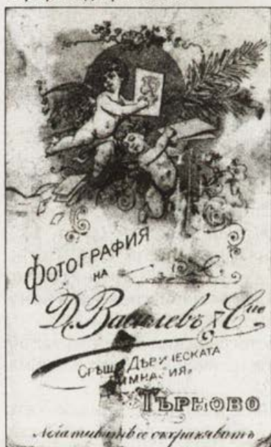
Обр. 12. Фирмен картон на Д. Василев