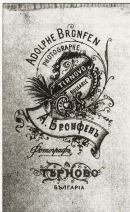
Обр. 20. Вторият фирмен картон на А. Бронфен

тон, със същото оформление от фирмата СЕСО. Надписите са ръкописни на български, а само името на В. Търново е и на френски с печатни букви.