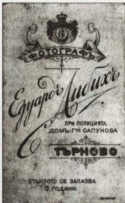
Обр. 15. Фирмен картон на Е. Либих