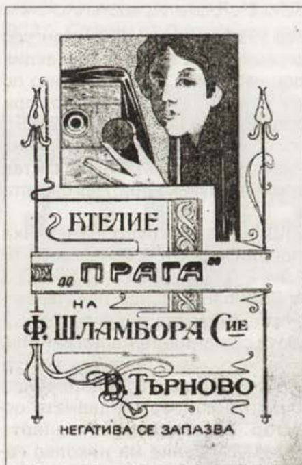
Обр. 26. Фирмен картон на ателие "Прага", 1908 г., фотограф Ф. Шламбора и Ц. Хараламбиев