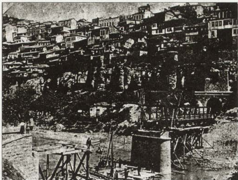
Обр. 17. Строежа на ж.п. моста между двата тунела, фотограф А. Бронфен

си във фабриката за вейлки в Килифарево; настоятелството на църквата "Св. Никола – лети" с. Златарица; великотърновски ловци край с. Хотница.