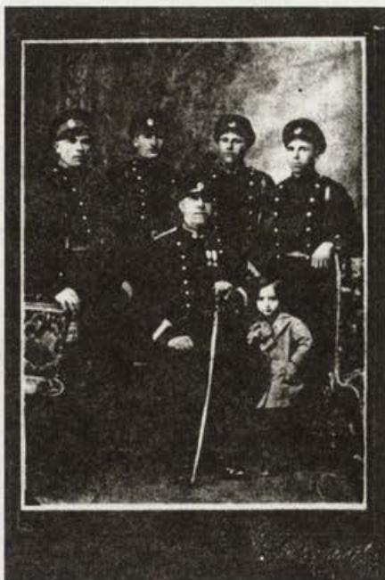
Обр. 24. II полицейски участък, 1932 г.