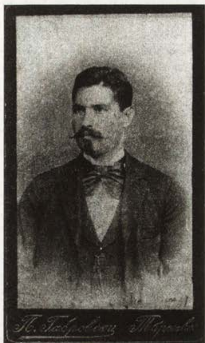
Обр. 14. Търновски учител