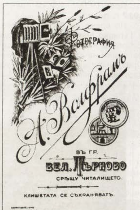
Обр. 11. Фирмен картон на А. Волфрам