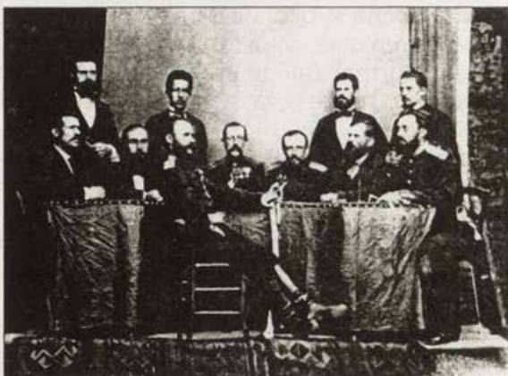
Обр. 7. Първата наборна комисия 1879 г., фотограф О. Марколеско

По време на Учредителното събрание на 10–16 февруари 1879 г. той снима депутати от всички краища на страната. По тези снимки по-късно се изработва табло на участниците в събранието. Негово дело са снимките на 17 пехотна дружина на княз Дондуков-Корсаков, на трета рота на Търновската