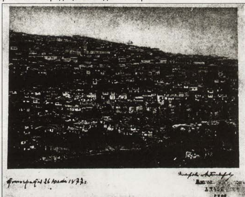
Обр. 9. Панорама на града

По време на Руско-турската война като военен фотограф в Търново пристига Йозеф Кордиша. До тогава е работил като фотограф на Киевския университет. Той снима поредица от 15 панорами на града, от които до нас са достигнали пет ( Обр. 9 ). През 90-те години на XIX в. в Русия той ги издава като пощенски картички в поредицата "Виды Болгарии".