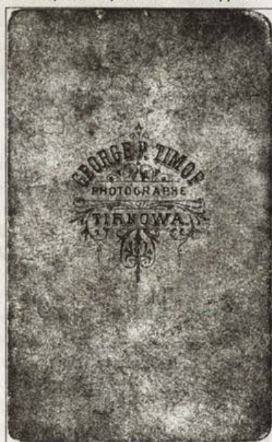
Обр. 13. Фирмен картон на Г. Тимов