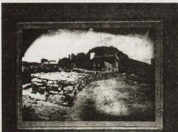
Обр. 8. Третата порта на Царевец, фотограф О. Марколеско

дружина, на първата наборната комисия за формиране на българската войска ( Обр. 7 ), украсата на града за посрещането на княз Ал. Батенберг, делегатите на I, II, IV Велико народно събрание. Неговият обектив запечатва множество обществено-политически, административни и културни събития от местен характер. Автор е на снимките, документирани археологическите паметници, илюстриращи изследванията на К. Шкорпил ( Обр. 8 ), оригиналните заснемания на народна празнична носия и хора от В. Търновско за първия мострен панаир през 1892 г. Той пръв снима княз Александър Батенберг и прибавя към името си – ПРИДВО-РЕН ФОТОГРАФ.