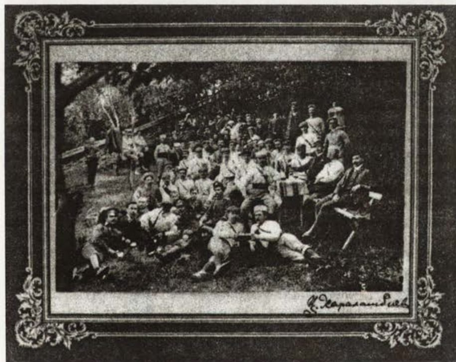
Обр. 28. Колоездачно дружество на излет до Елена, 1909 г.