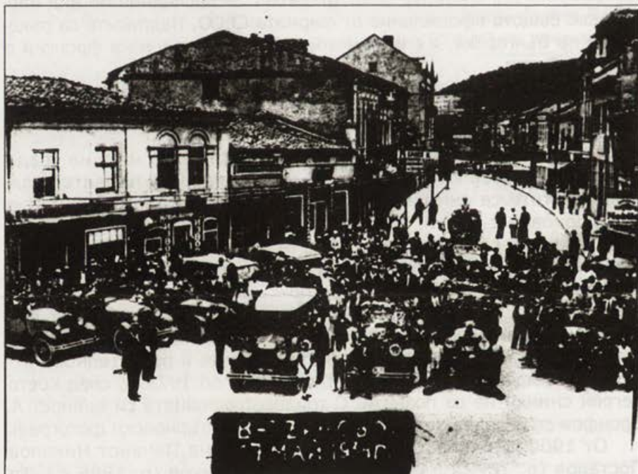
Обр. 23. Празник на шофьорите – 17 май 1934 г., Спасов ден

От съвместната им дейност са останали като спомен за поколенията мигове от живота на Търново: Градския струнен оркестър 1903 г., Спомен от Окръжната земеделска изложба 1905 г., Обявява-