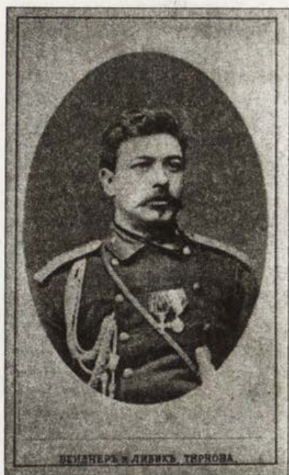
Обр. 10. Портрет на неизвестен