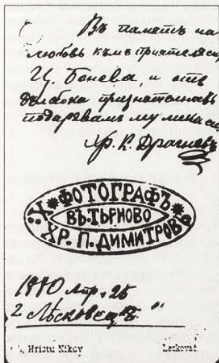
Обр. 4. Мокър печат на х. Христо п. Димитров