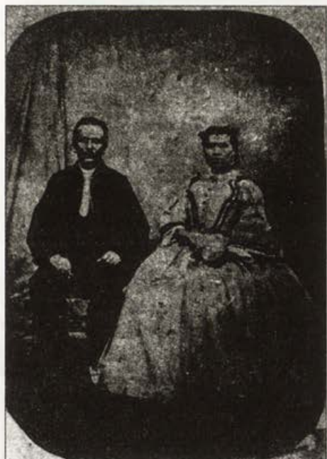
Обр. 1. Неизвестно търновско семейство, 1853 г.