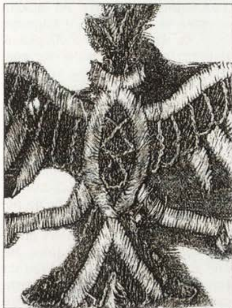
Обр. 1. Фрагмент от одеждата с монограми на цар Иван Александър от Станичене – двуглав орел от втората лента (по А. Нитич и Ж. Темерински)