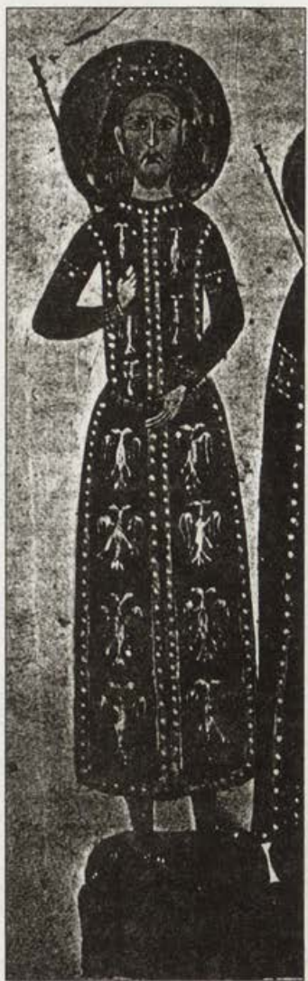
Обр. 4. Миниатора от Лондонското евангелие на Иван Александър. Британски музей – Лондон (История на България, т. 3)

ние върху дрехата. Те достигат до извода, че тя може да е изглеждала донякъде като тази без ръкави, с която е представен деспот Константин, зет на цар Иван Александър, в Лондонското евангелие 7 (Обр. 4).