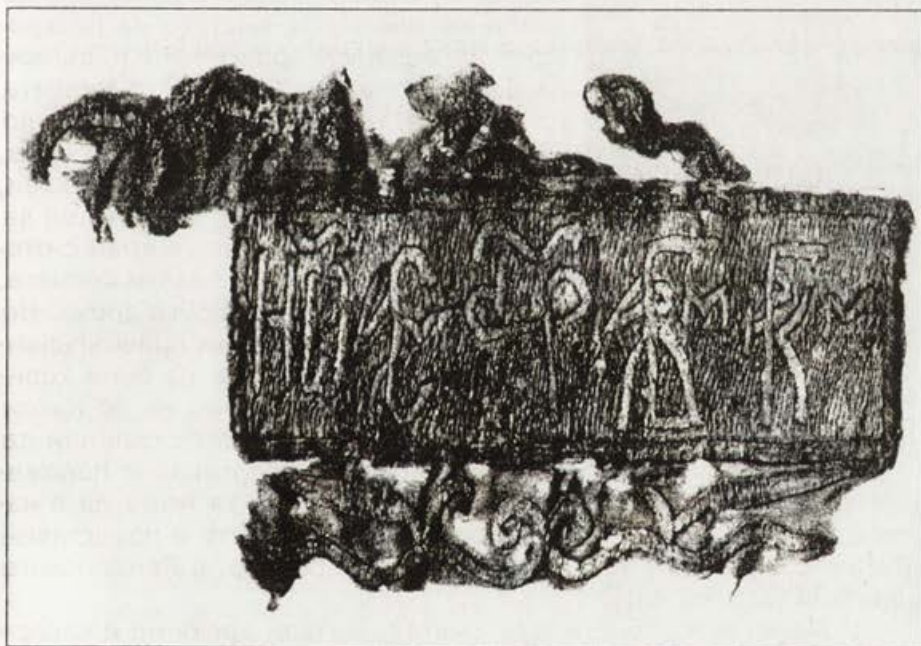
Обр. 2. Фрагмент № 24 от одеждата с монограми на цар Иван Александър от Станичене – растителни мотиви и надпис (по А. Нитич и Ж. Темерински)