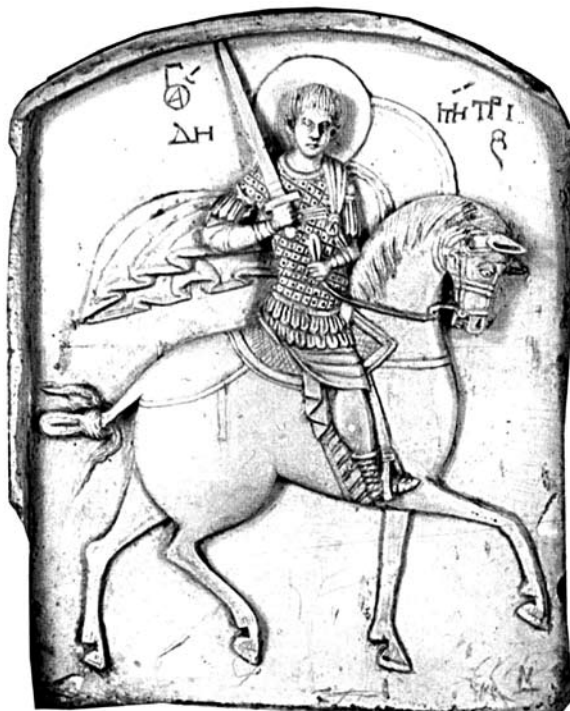
Фиг. 2 Стеатитова иконка със св. Димитър като конник-войн, край на XIII–начало на XIV в. (по А. Bank)

Образите на св. Димитър като конник-войн започват да се представят все по-често върху разнообразни предмети едва от края на XIII век насетне. Между тях ще спомена само добре известната стеатитова иконка, съхранявана в сбирка-