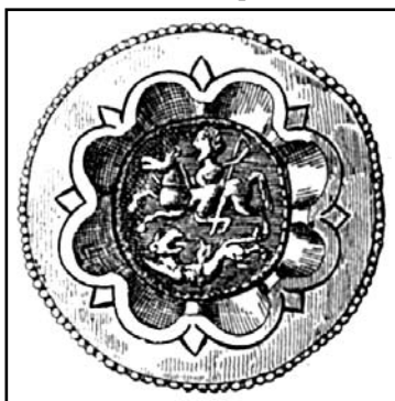
Фиг. 4. Фибула, намерена в гроб 12 при базилика №2 при античния град Nereum (по Hampe)