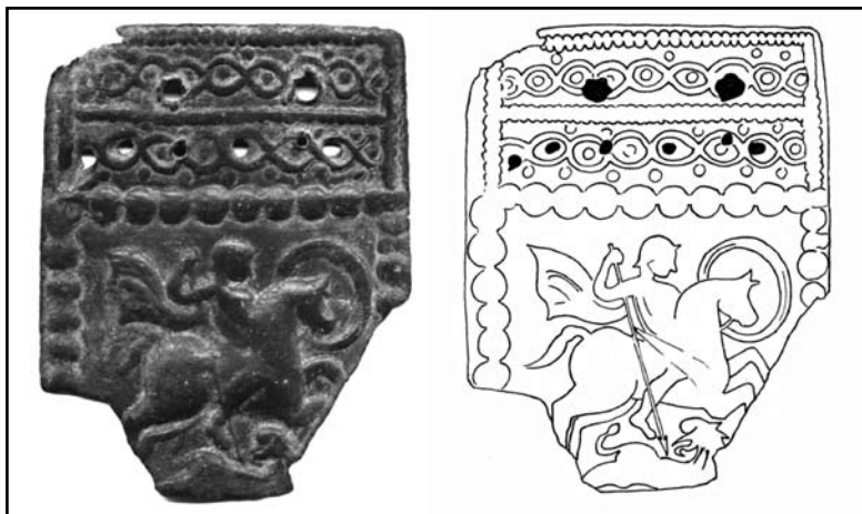
Фиг. 1. Апликация от сандъче от сбирките на НИМ