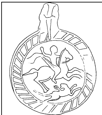
Фиг. 2. Оловен амулет от СЗ България с изображения на Белерофонт и Химера, III-IV в., частна сбирка