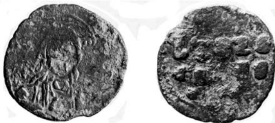
Обр. 2. Голямомодулна имитация на византийски анонимен фолис от клас А, изработена чрез отсичане.

Втората от публикуваните понастоящем имитационни монети от Силистра е изработена чрез друга техника – чрез отсичане посредством специално гравирани за целта матрици. Очевидно е, че гравьорът, изработил тези матрици, е бил неопитен и незапознат с латинските букви, с които е изписан надписът върху обратните страни на оригиналните византийски фолиси от клас А. Поради това,