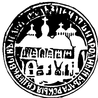
Фиг. 8. Печат на бълг. църква “Св. Стефан” от 1858 г. (по Възвъзова-Каратеодорова)

Уставът предвиждал двустепенно управление на църковната община – надзирателство от 5 души и настоятелство също от 5 члена плюс 5 представителя на еснафите в Цариград. Ежегодно с едногодишен мандат 2 души от настоятелството (един търговец и един от еснафите) се присъединявали към надзирателството, като тези 7 души представлявали пълното надзирателство на църквата . Ето и техните имена: