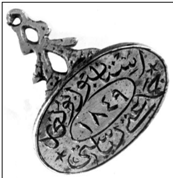
Фиг. 1. Печат на председателя на бълг. община от 1849 г. (Хартиен отпечатък)