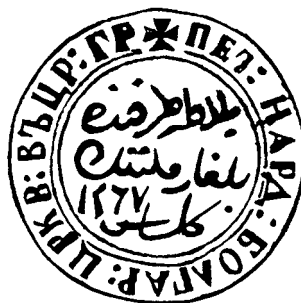
Фиг. 7. Печат на бълг. църква “Св. Стефан” от 1851 г. (по Възвъзова-Каратеодорова)

бъде поставян върху “по-маловажните документи” от писаря и председателя по заповед и позволение на настоятелството 17 . Писарят и председателят съхранявали малкия печат и подпечатвали с него “призователни и за тезкеретата поручителни писма” , които не носели финансови задължения за църквата. Най-строго се санкционирали онези, които предоставяли ключа на касата, печатите или частите на големия църковен печат на други лица. Наред с подписите на 2/3 от настоятелите, общият голям печат се полагал върху документи за заеми или задължения на църквата, както и върху отчетните книги на църковната каса. Великият печат от 1851 г. е описан от Начов – кръгъл, наоколо надпис “Народ. Болгар. Цркв. въ Ц:гр” и в средата на турски (т.е. на арабица) написано “Balat tarafında bulgar milletinin klisesi. 1267.”, което на български значи: “Храм на бълг. народност в местността Балат” 18 . 1851. 19” (Фиг. 7)