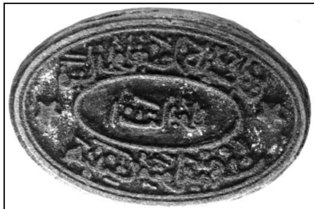
Фиг. 2а. Печат на председателя на църк. настоятелство на “Св. Стефан” (сн. Р. Колев)