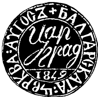
Фиг. 5. Печат на бълг. църква от 1849 г. (по Възвъзова-Каратеодорова)

Малият печат , за който говори Сапунов, най-вероятно се е ползвал от председателя на избраното през август 1849 г. настоятелство, който можел да го поставя върху документи с нефинансов характер и необвързващи църквата със задължения, както се вижда от по-късния устройствен устав на общината. Известен е един странен отпечатък от 1849 г., който с много голяма вероятност можем да считаме, че е т. н. малият печат . (Фиг. 5) 11 . Той не е многоделен и в страничния банд е изписан месецът “аугосъ”, което нарушава обичайната практика, но пък директно го свързва с важното събрание от август 1849 г., подобно на първия печат от НИМ.