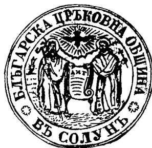
Фиг. 3. Печат на бълг. църковна община в Солун (по Й. Иванов).

институцията изображение. Така в рамките на задължителното изискване била проявявана свобода на символния израз, което удовлетворявало специфични нагласи в дадената общност (Фиг. 3).