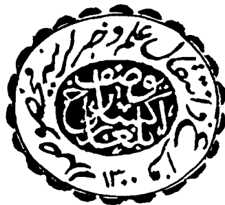
Фиг. 6. Длъжностен печат на екзарх Йосиф I.