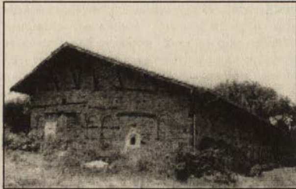
Обр.2. Църква "Св. Архангели Михаил и Гавраил" в Арбанаси. Поглед от североизток.

граница е гробът на Константин Бранковияну, починал през 1790 г. 17 . Ситуирането на гробното съоръжение недвусмислено показва, че разположението му е диктувано от вече съществуващите архитектурни дадености на параклиса. И ако това наистина е безспорно, то по отношение тезата за пристрояването ние имаме сериозни резерви.