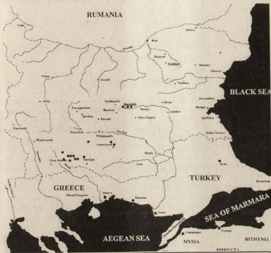
Таблица VIII 1. Карта на шлемовете разглеждани в статията.