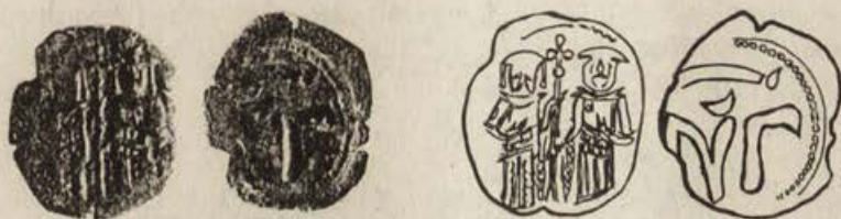
Обр.4а; 4б. Меден асарион на Андроник II с Михаил IX с индикт III=1304/1305 или 1319/1320 г.

15 екз.; 20 – 21 мм; Ср. Т. 1,50 – 1,60 г.; Обр.4 а и Обр. 4 б.