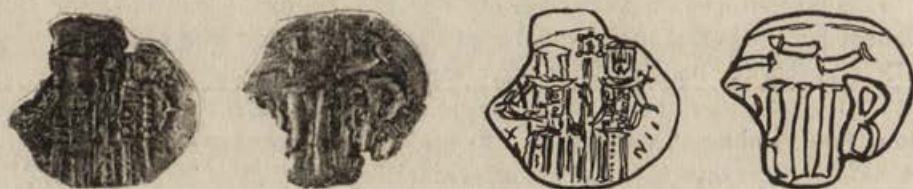
Обр.2а; 2б. Билонова трахея на Андроник II с Михаил IX Палеолог/1295-1320/ с индикт II=1298/1299 г.

3 екз.; Д. 22 мм; Ср. Т. 1,30 г; Обр.2а и Обр. 2б.