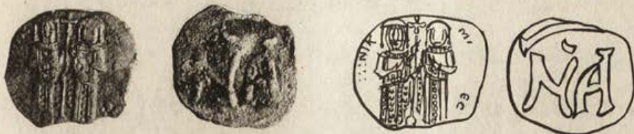
Обр. 3а; 3б. Меден асарион на Андроник II с Михаил IX с индикт I=1302/1303 или 1317/1318 г.

14 екз.; Д. 21 мм; Ср. Т. 1,70 – 1,80 г.; Обр.3а и Обр.3б.