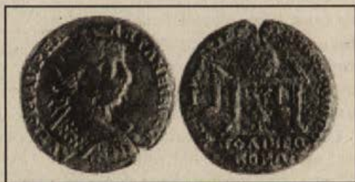
Обр.3. Бронзов медальон на имп. Елагабал (218-222 г.) от Филипопол.

Както е известно, в 218 г. във Филипопол са учредени игри, наречени ΚΕΝΔΡΕΙΣΙΑ по епитета на бога-покровител на града Аполон Кендризос. 9 Те са посветени на император Елагабал като благодарност за получената от Филипопол неокорска титла, т.е. правото на града да упражнява култа към императора. Връзката между името на игрите и отъждествяващия се с бога на слънцето император е съвсем ясна. В чест на тези две събития (полученият неокорат и Кендризийските игри) във Филипопол са отсечени редица медальони.