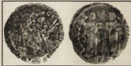
Обр.1. Бронзова монета на имп. Септимий Север (193-211 г.) от Филипопол.

Най-ранната монета е бронз на Септимий Север (193-211 г.), сечен във Филипопол (Обр.1). 2 Лицето ѝ е повредено, но се вижда главата на императора с лавров венец, обърната надясно. Част от надписа е запазен: Α...Α ΣΕ.../ΣΕ... Върху гърба на монетата е класическо изображение на Асклепий и Хигия, прави, един срещу друг. Асклепий е вдясно, с обърната наляво към Хигия глава, с дясната си ръка се подpira на тояга с увита змия, лявата е поставена пред тялото му. Хигия