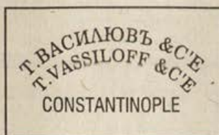
Обр.4. Четвърти печат.

Текстът е изпълнен на кирилица и латиница с височина на буквите 3 мм и 4 мм. Използвани са два печатарски шрифта.