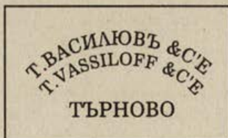
Обр.2. Втори печат.

1. T.ATANASSOFF & T.VASSILEFF 2. ROSTSCHUK, разделен от две стилизирани фигури, наподобяващи растителен мотив. Използвани са два печатарски шрифта. Буквите са с височина 2 мм, печатани на латиница.