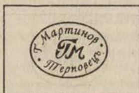
Обр.6. Шести печат.

Лавров венец с панделка, опасващ долната част на изобразителното поле, затваря кръга около монограма. Две тънки врязани линии очертават контурите на печатащата част.