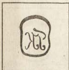
Обр.7. Седми печат.

допуснал грешки при избора на букви. Вместо "ТЪРНОВЕЦ" е изписано "ТЕРНОВЕЦ".