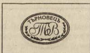
Обр.5. Пети печат.

Релефен печат, отпечатък в позитив върху червен восък.