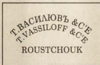
Обр.3. Трети печат.

1. Т.ВАСИЛЮВЪ & С е ; 2. Т. VASSILOFF & С е ; 3. ТЪРНОВО. Използван е един печатарски шрифт. Буквите са изпълнени на кирилица и латиница, с обща височина 4 мм.