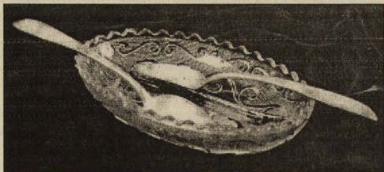
Обр.7. Стъклен лъжичник и сребърни лъжички.