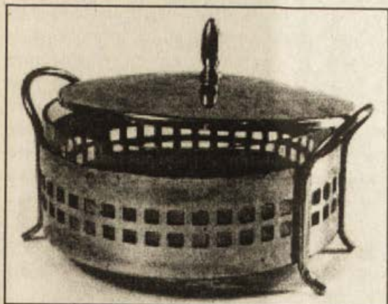
Обр.1.Метално корубче за сладко.