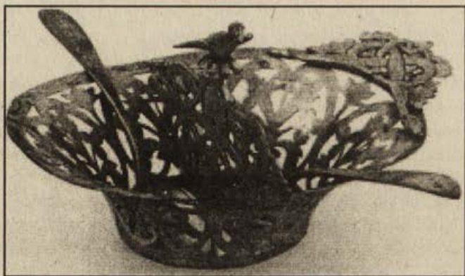
Обр.5. Метален лъжичник и метални лъжички с герб върху лицевата повърхност на дръжката.