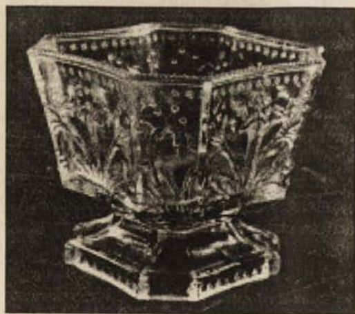
Обр.3.Стъклено корубче за сладко с релефна украса.