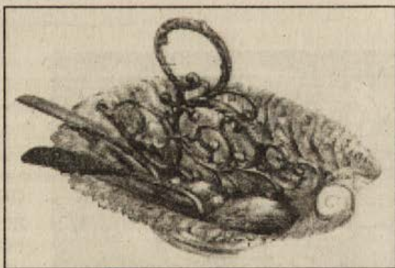
Обр.4. Бронзов лъжичник със столче и разделителна преграда – дръжка и метални лъжички.

Особено изящен е металният лъжичник с форма на мидена черупка и столче. Периферията е с дълбоко релефни фестони. Разделителната преграда е изработена ажурно с растителни орнаменти, декоративни зърна и дръжка в средата (Обр.4). Интерес представляват лъжичниците с