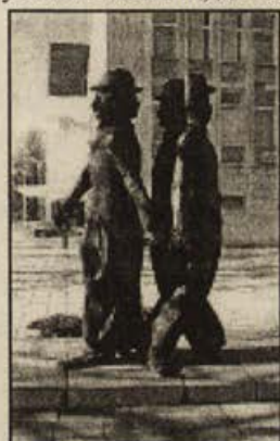
Георги Чапкънов. Чарли Чаплин, бронз, 1983 г., “Парк на смеха”, ДХС, Габрово.