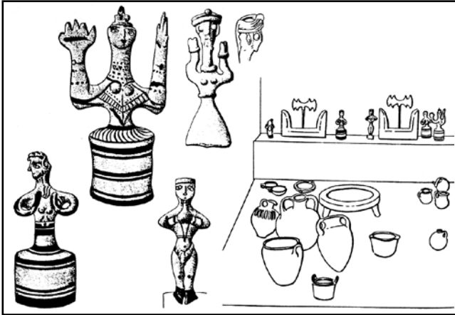
Обр. 2. Глинени фигури, открити в "Параклиса на двойните бравди" в Кносос на о-в Крит (по Müller-Karpe)