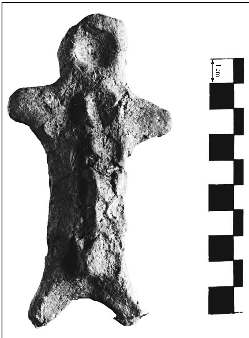
кат. № 7