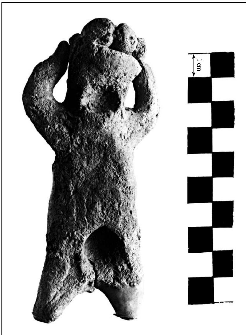
кат. № 4