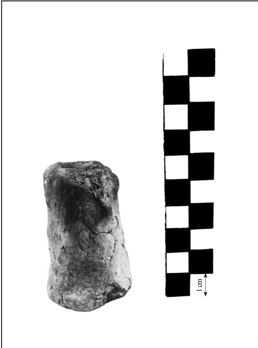
кат. № 16