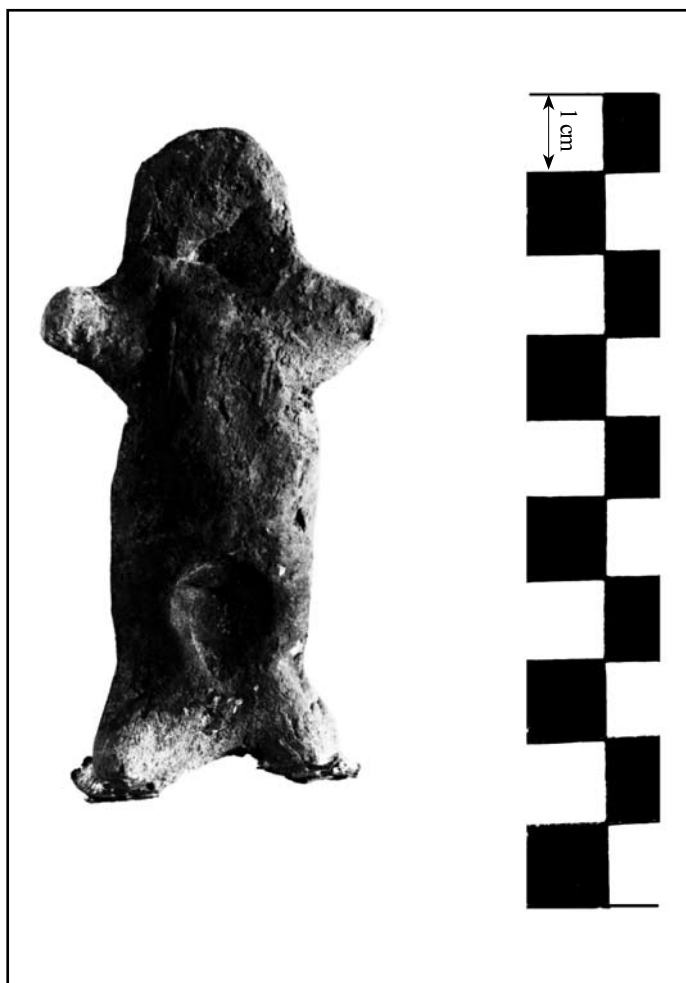
кат. № 1