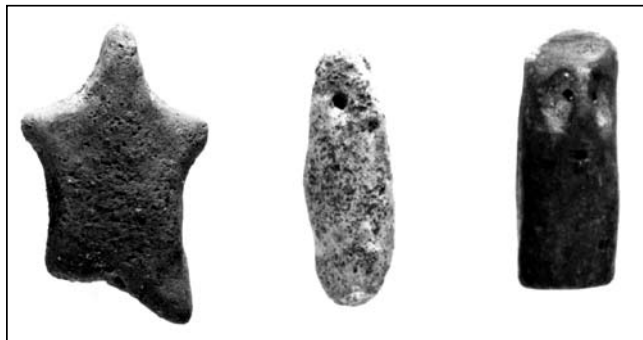
Обр. 1. Антропоморфни стълбчета и кръстовидна фигурка от некропола на Аполония Понтика, IV в. пр. Хр.

формулата дава достатъчно възможности за тълкуване, тя би следвало да се прилага предпазливо по отношение на подобни материали от предходните столетия, каквито са фигурите от с. Конево. Несъмнено е, че подобни изображения могат да се приемат като макар и формално продължение на традиция, чиито корени се откриват още в неолита и която може да се проследи