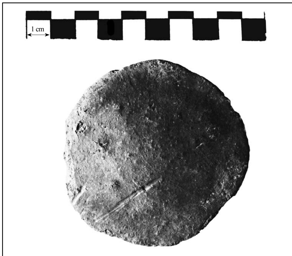
кат. № 12