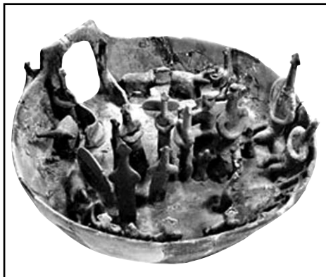
Обр. 6. Култова сцена от некропола при Вунус на о-в Кипър (по Karageorgis V. 1989. The Cyprus Museum)

• Условността и статичността на образите (и евентуалните движения?) съответно обуславят и силно хипотетичния характер на предположенията за това, дали в случая е направен опит да се предаде кръгов танц или статична поза, заемана в ритуала. Паралелите разбира се са кос-