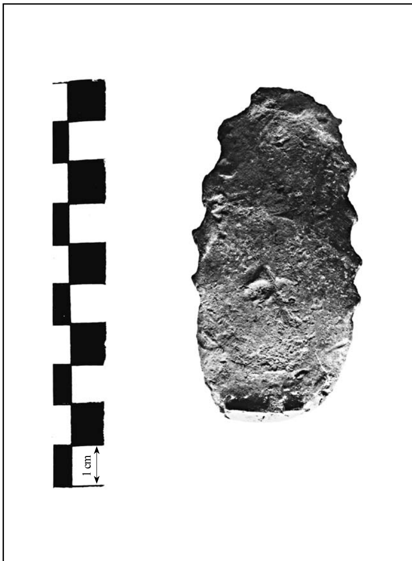
кат. № 13