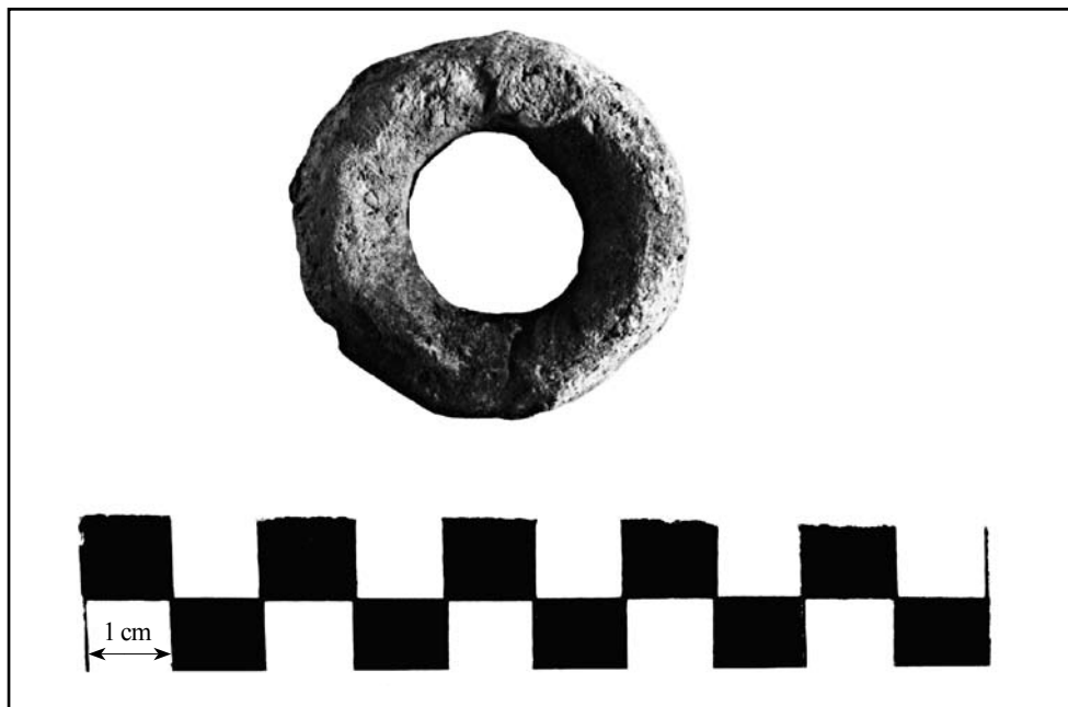
кат. № 10