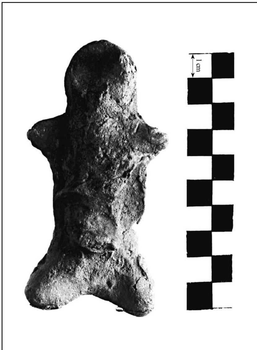
кат. № 6