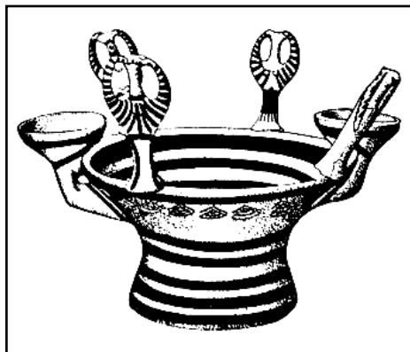
Обр. 5. Съд с “Ф” идоли и купички от некропол III C в Микена. (по Müller-Karpe)

Повече затруднения предизвиква идентификацията на предметите с № 10, които са с форма на пръстени със заоблено, почти кръгло напречно сечение. Предположенията могат да варират в доста