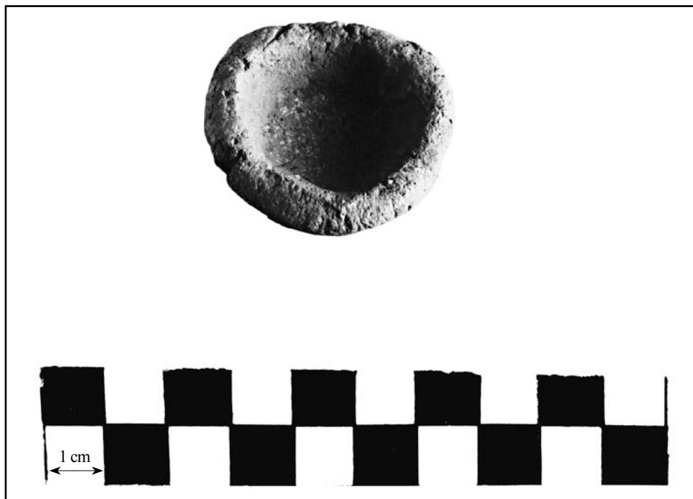
кат. № 11