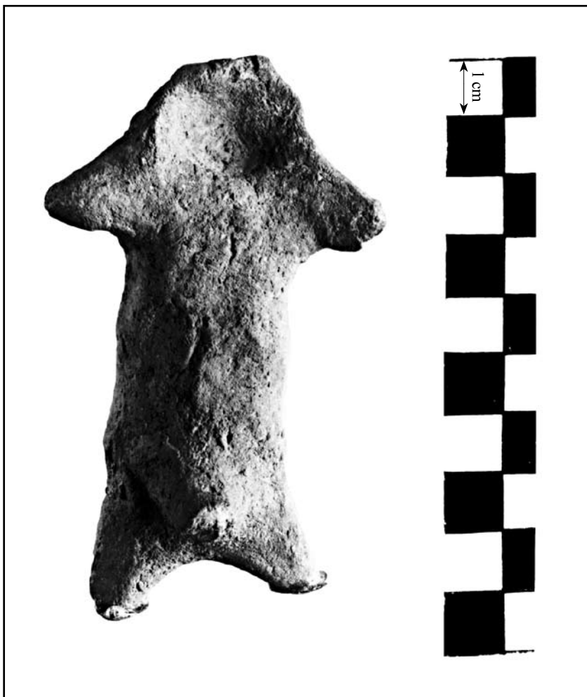
кат. № 3