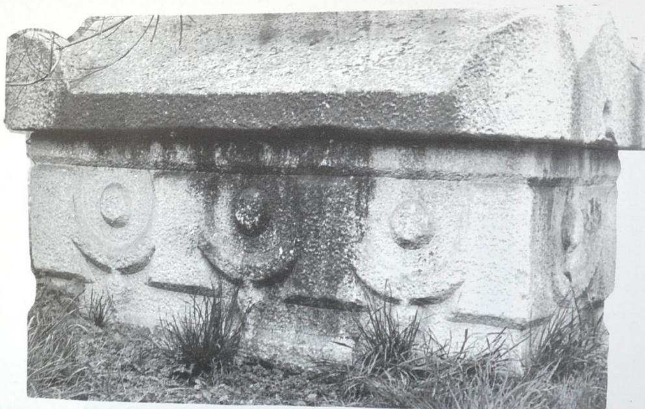
Фиг. 4. Проконески саркофаг – гирлянден полуфабрикат от Одесос. Fig. 4. Proconessos sarkophagus – garland semi-manufacture article from Odessos.