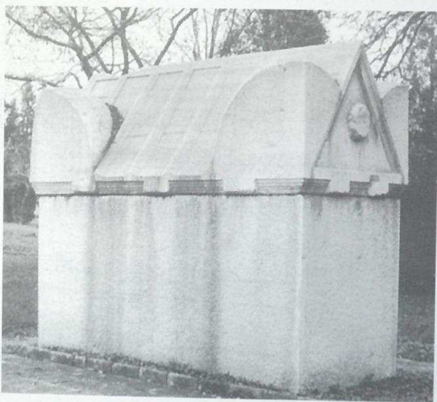
Фиг. 6. Проконески саркофаг без украса от Марцианопол. Fig. 6. Proconessos sarkophagus without decoration from Marcianopolis.