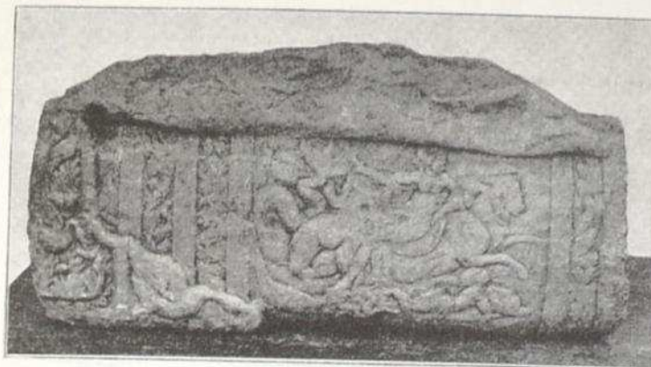
Фиг. 3. Фрагмент от клине-капак на атически саркофаг от Одесос. Fig. 3. Fragment of cline-cover of Attic sarkophagus from Odessos.