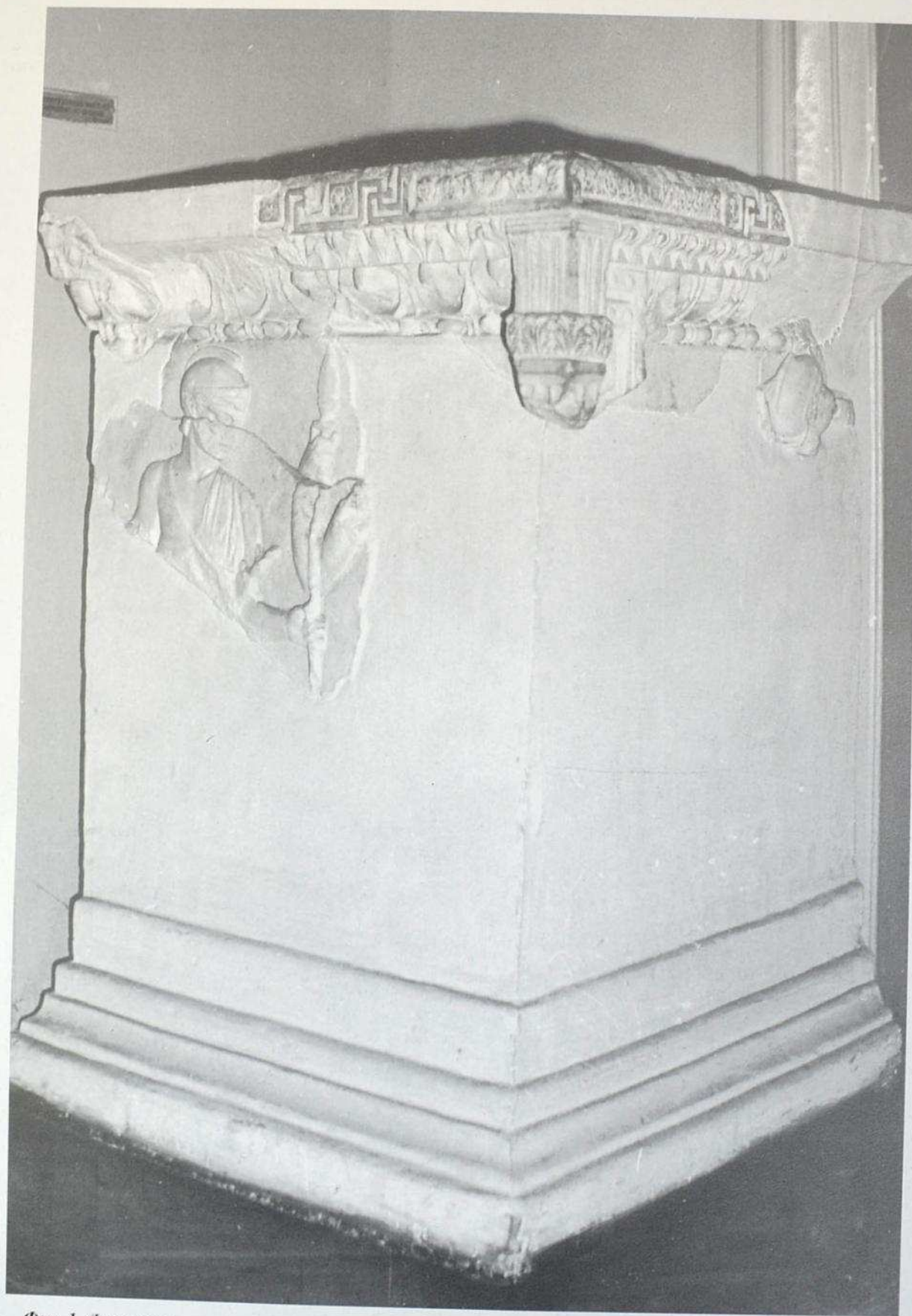
Фиг. 1. Фрагменти от атически саркофаг от Одесос. Fig. 1. Fragments of Attic sarkophagus from Odessos.