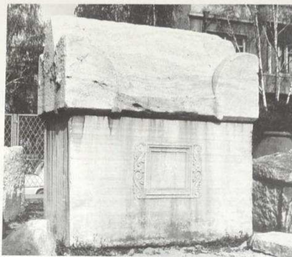
Фиг. 5. Проконески саркофаг с tabula ansata от Марцианопол. Fig. 5. Proconessos sarkophagus with tabula ansata from Marcianopolis.