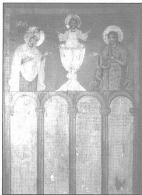
Обр. 2 Поменик, с. Павелско, Смолянско – средата на XIX в.

Доколкото ми е известно, само тревненци използват подобна иконография за декориране на помениците. В триптих-поменик от манастира “Св. Никола” в Арбанаси 29