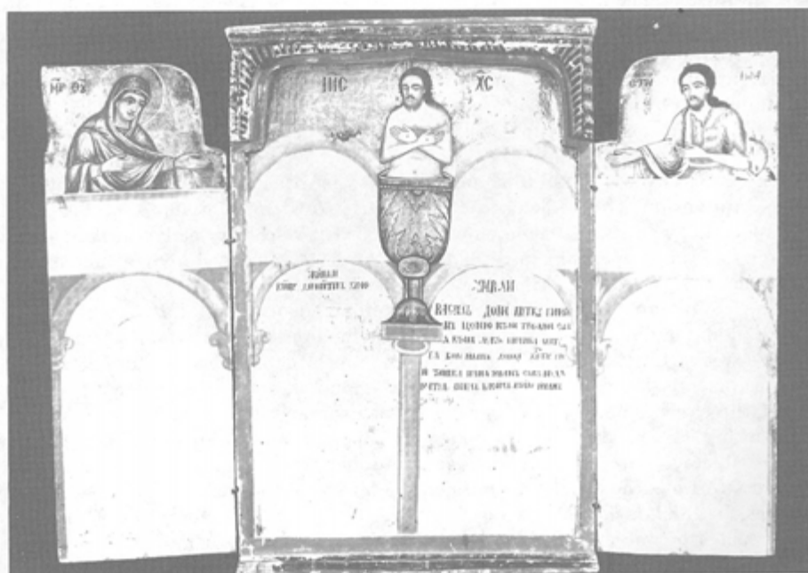
Обр. 1 Триптих-поменик от с. Коювци. НИМ

Очевидно триптихът е изработен през 1852 г., а на 14 декември е подарен на църквата. Данни за името