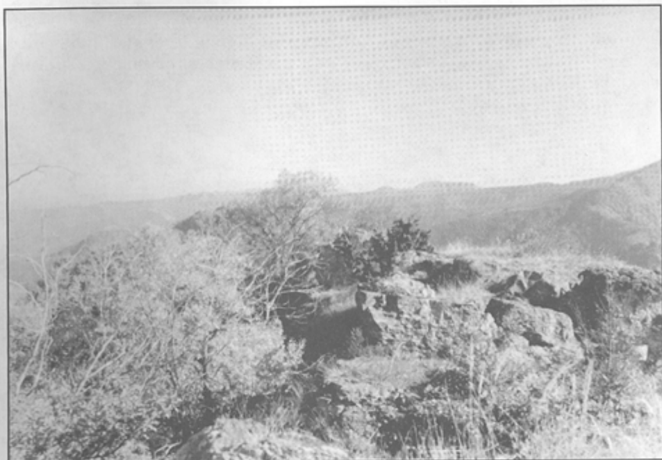
Обр. 2 Светилището в м. "Кедрия" – поглед от северозапад.

с размери 0,80 / 1,40 м. Върху нея е изсечен равностранен триъгълник с дължина на страните 0,30 м. Фигурата е съзнателно изсечена на дълбочина 0,10 м върху скалата. Ъглите на триъгълника са ориентирани на 340° северозападно; 220° югозападно и 120° югоизточно.