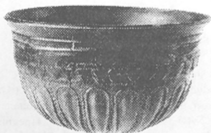
Табл. III. Фирнисови съдове от Аполония (1,3), аскос от Каблешково, Бургаско (2)

Месамбрия и Аполония 50 и обединяват предимно чаши с растителни мотиви, чиято стилистика е характерна за ателиетата на "Монограмиста", Менемах и др. 51 Макари и по-рядко, се срещат и чаши с "S"-овиден силует и издаден силно навън устен ръб, известни още като "пергамски" или "антиохийски" чаши (Табл. III/3). По принцип, чашите с релефна украса от българското Черноморие се считат за импорти, но специфичният сив цвят на глината при някои от тях, твърде различен между впрочем от сивия цвят на малоазийските чаши, предполага и местното им производство по внесени отвън калъпи.