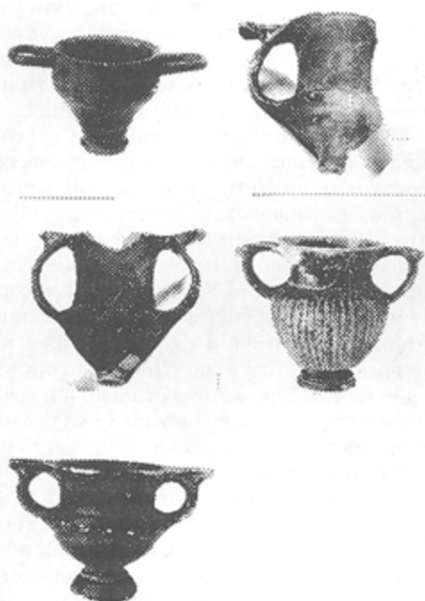
Табл. II. Фирнисова керамика от Аполония