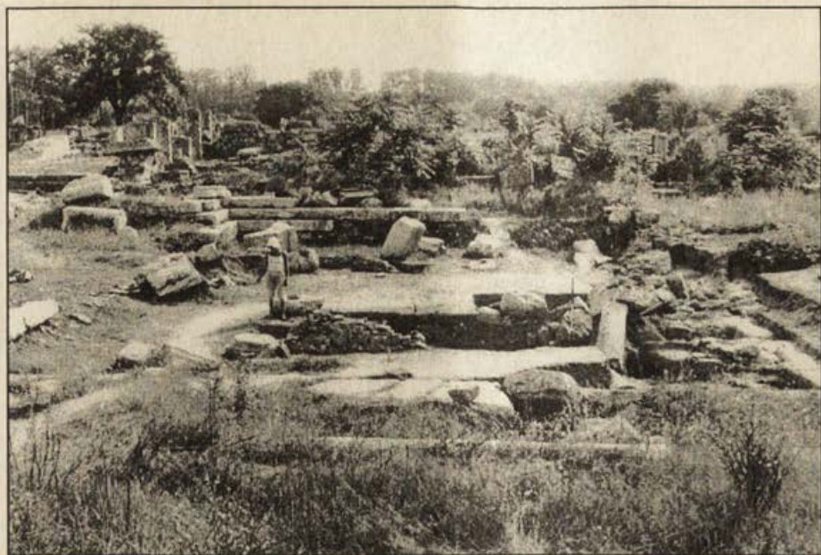
Обр. 2. Югозападна част на комплекса на Агората - от запад.

част на блоковете е оставала невидима, закривана от настилката на ареята, независимо каква е била тя. Страницата, която лежи върху крепидата, е грубо обработена. Блоковете на средното и горното стъпала лягат плътно и почти без фуга върху блока от по-долното стъпало. Височината на всяко едно от тях е 0,3 м. Вероятно същата височина над настилката е имало и долното стъпало. Следователно, че общата височина на стилобата над настилката на ареята е била 0,9 м.