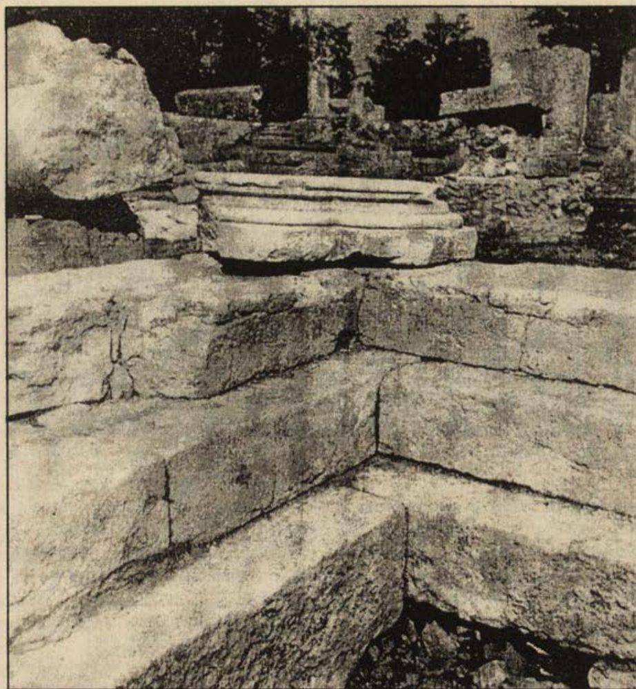
Обр. 3. Североизточен ъгъл на портика.