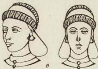
Обр. 2 а,б,в. Остатъци от сърмена украса върху черепа от гроб No 1. Опит за графична реконструкция