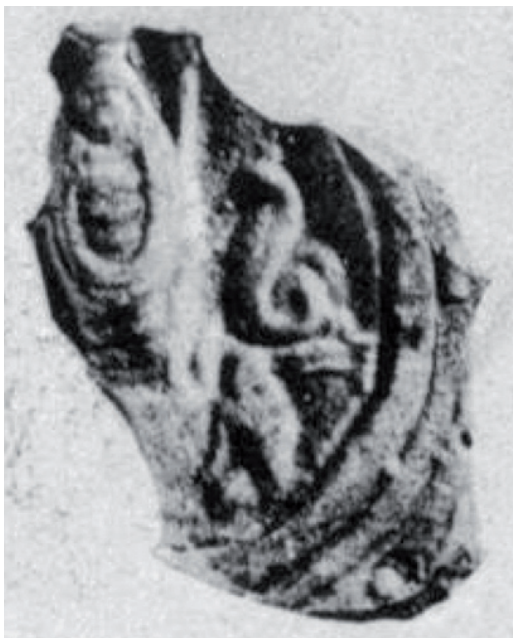
Фигура 6. Фрагмент от лампа от акропола в Атина, Музей на Агората инв. № L2695 (кат. 5) Figure 6. Fragment of lamp from the acropolis in Athenes, Agora Museum inv. № L2695 (cat. 5)

Няма съмнение, че брадатият мъж в центъра на композицията върху шестте лампи е Сарапис – гръко-египетско божество, създадено по времето на първите Птолемеи, т.е. наместниците на Александър Велики в Египет, за да задоволи религиозните нужди както на местното египетско, така и на новодошлото – гръцко население 3 . Сарапис се появил като комплексно творение в района на Мемфис (днешно Кайро). Самото име