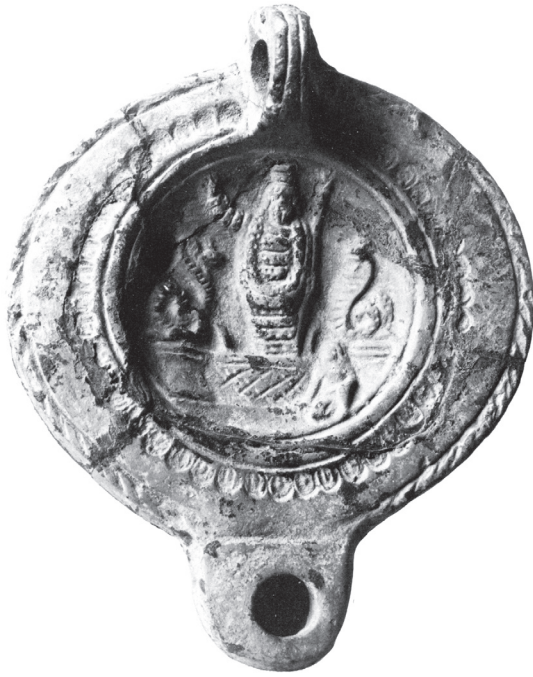
Фигура 5. Лампа от Сарди, Турция, Ägyptisches Museum und Papyrussammlung, Берлин инв. № ÄМ 9724 (кат. 4) Figure 5. Lamp from Sardi, Turkey, Ägyptisches Museum und Papyrussammlung inv. № ÄМ 9724 (cat. 4)

такава (кат. 1, виж фиг. 2). Лампата от Деултум също има украса по целия ѝ край, която по-скоро наподобява листа от маслина. Украсата на лампата от Сарди (кат. 4, виж фиг. 5) е във вътрешната част, около диска и се състои от полусферични елементи, подредени един до друг. В диска на лампите детайлите от лицето на изправената мъжка централна фигура се виждат най-добре при екземплярите от Деултум и Сарди. Те са и единствените, при които олтарът е предаден с мрежеста украса. Божествата във всички лампи носят корони, но само при лампата от Деултум детайлите им се виждат особено ясно, което ще спомогне според нас за по-доброто разчитане на композицията.