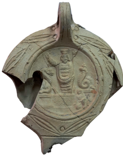
Фигура 1. Лампа от Деултум, Археологическият музей с резерват – Дебелт, инв. № 122.

Keywords: Thrace, Egypt, Sarapis, Isis-Thermuthis, Sarapis-Agathodaimon, Roman Lamps