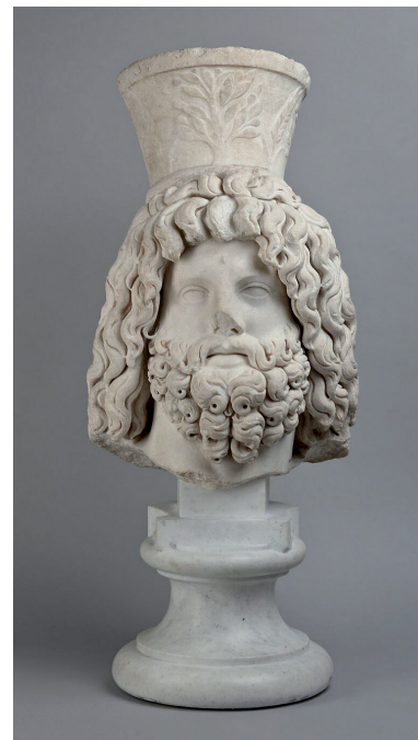
Фигура 7. Глава на Сарапис с калатос от Картаген, Римска епоха, Лувър инв. № Ма 1830 Figure 7. Head of Sarapis with calathos from Cartage, Roman period, Louvre inv. № Ma 1830