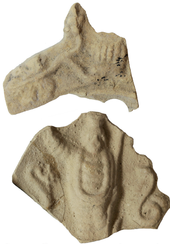
Фигура 4. Фрагмент от диск на лампа от Херсонес Таврически, Музей Херсонес инв. № 2866 ( кат. 3 ) Figure 4. Fragment of the disc of lamp from Chersonesus, Chersonesus Museum inv. № 2866 ( cat. 3 )