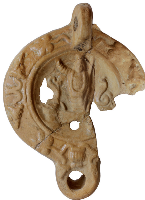
Фигура 3. Горна част на лампа от Херсонес Таврически, Музей Херсонес инв. № 957 ( кат. 2 ) Figure 3. Upper part of lamp from Chersonesus, Chersonesus Museum inv. № 957 ( cat. 2 )