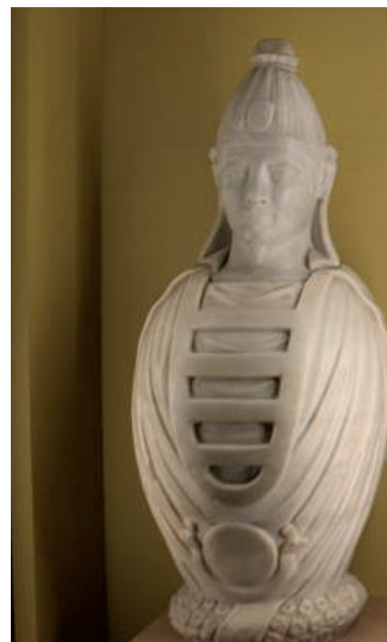
Фигура 9. Статуетка на Озирис-Каноп с гирлянд от Изеума в Рас ел-Сода, Музей Александрия