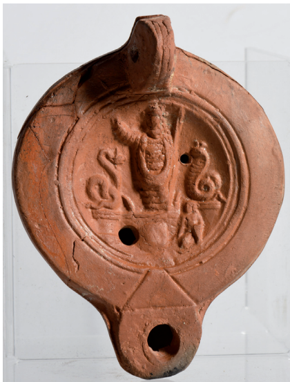
Фигура 2. Лампа от Херсонес Таврически, Ермитаж инв. № X. 1896,47 ( кат. 1 ) Figure 2. Lamp from Chersonesus, Hermitage inv. № X. 1896,47 ( cat. 1 )

Общо пет лампи с подобна иконография са открити на различни места, намиращи се в източната част на Римската империя (виж по-долу Каталог 1 – 5 и фиг. 2 – 6 ). Три идват от погребения в Херсонес Таврически, в югозападната част на кримския полуостров, една от Сарди, Турция, и една от акропола в Атина 2 . При всички лампи иконографията в диска на лампата е много сходна. Различията са по-скоро в детайлите. Две от лампите от Херсонес Таврически имат сходна украса по ръба от лозови листа и гроздове ( кат. 2, 3 , виж фиг. 3, 4 ), докато при третата липсва